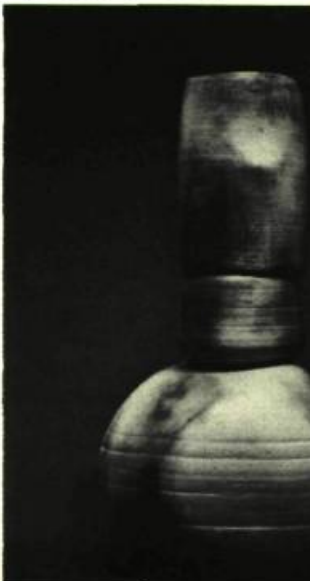
1. Claude PRAIRIE Trois Mages , 1983. (un de la série)