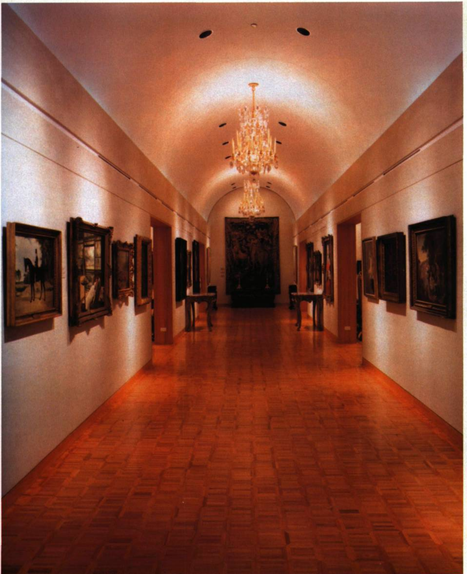
3. La Galerie voûtée.