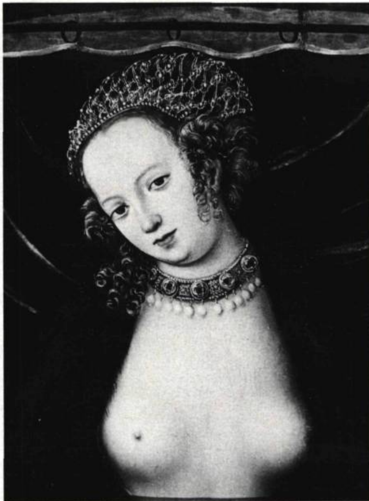
7. Lucas CRANACH le Jeune Lucretia, v. 1530. Huile et détrempe sur panneau. Coll. Hosmer-Pillow-Vaughan.

Si on lui ajoute la prééminente collection de toiles britanniques que le Musée abritait déjà, et dont une partie est exposée dans la nouvelle galerie Sir Max Aitken (portraits, scènes d'intérieur et paysages, du 17 e au 19 e siècle), ainsi que l'ensemble des œuvres canadiennes qu'elle comporte, cette remarquable collection, montée par trois générations de Canadiens au goût sûr, procure, au Musée Beaverbrook, une position unique dans le Canada atlantique, et très enviable pour le reste du pays. Voilà en somme, dans cette année du bicentenaire du Nouveau-Brunswick, une heureuse façon de marquer le 25 e anniversaire du Musée.