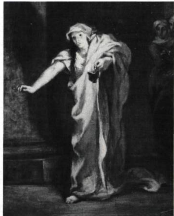
8. Eugène DELACROIX Lady Macbeth , 1850. Huile sur toile. Coll. Hosmer-Pillow-Vaughan.