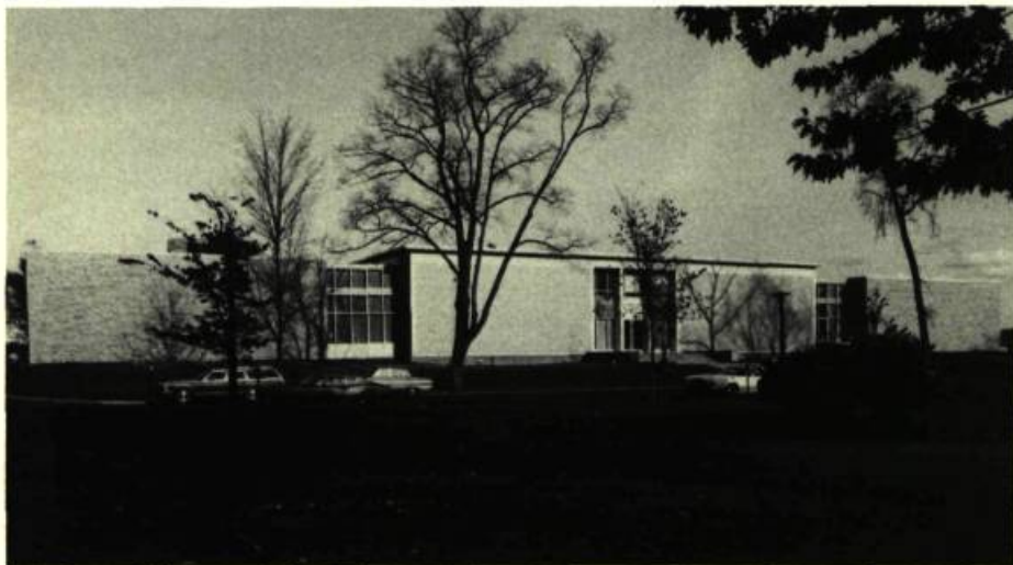
1. L'Extérieur du Musée Beaverbrook.

Par suite de l'adjonction de la Collection Hosmer-Pillow-Vaughan, de réputation internationale, le Musée Beaverbrook a élargi ses paramètres, s'ouvrant ainsi à trois nouvelles orientations au moins. Grâce à cette collection, le Musée a entrepris une étude des arts décoratifs – désormais, mobilier, tapisseries, porcelaine, argenterie et objets d'arts font partie de son mandat. Les beaux-arts et les arts décoratifs d'Europe continentale, un secteur qui n'apparaît qu'incidence parmi les possessions du Musée, sont suffisamment bien représentés pour illustrer le continuum artistique de l'Europe septentrionale et méridionale de l'époque médiévale à la fin du 19 e siècle. Les œuvres les plus anciennes qu'expose actuellement le Musée remontent au début du 14 e siècle, comme en témoigne un diptyque anonyme en ivoire de style gothique français,