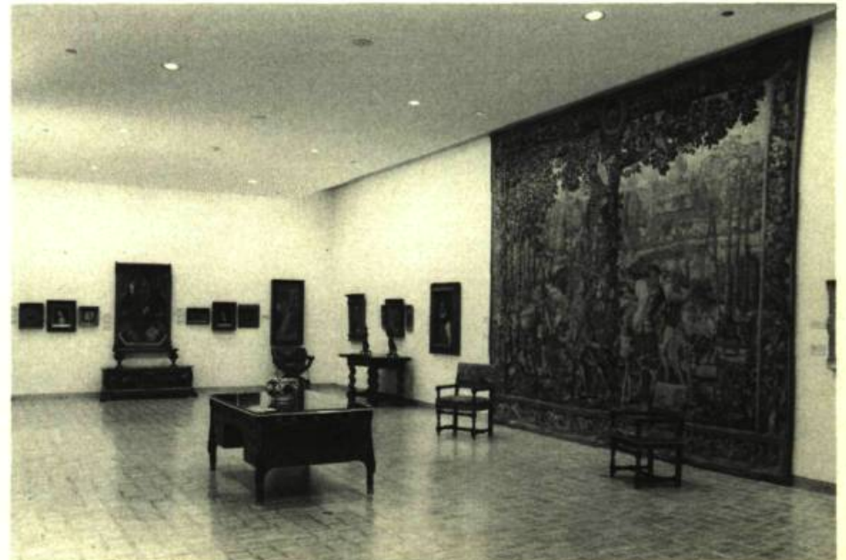
The Hosmer-Pillow-Vaughan Gallery

19th century France held considerable fascination for Elwood B. Hosmer as evidenced in the outstanding cache of paintings and water-colour studies he assembled by that precursor of Impressionism, Eugène Boudin. The seven works from the Collection represented here span the period from 1858 through the Trouville beach scenes done in the 1860's to the "Rivage de Berck" of 1886. With the complex disposition of multiple groups of figures, rendered in sombre earth tones in Boudin's "Pardon à Sainte-Anne-la-Palud" (1858) one can discern numerous parallels to the epic canvas by Courbet, "Burial at Ornans", painted three years earlier in 1855. It was in 1859 that Boudin exhibited the painting for which this is a study at the Salon des Artistes