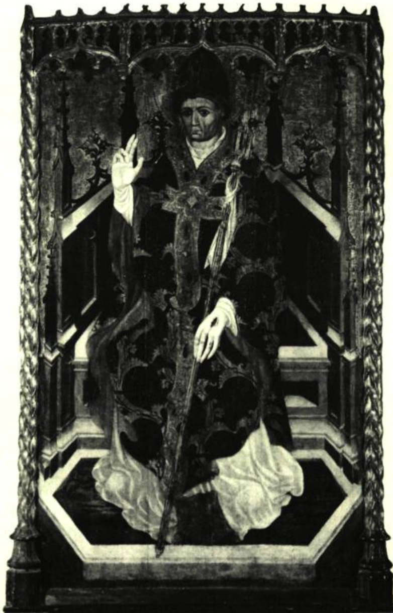
6. Jaime CIRERA Saint-Martin de Tours , v. 1440. Détrempe sur panneau. Coll. Hosmer-Pillow-Vaughan.

C'est au Havre, du reste, que Boudin prit connaissance des