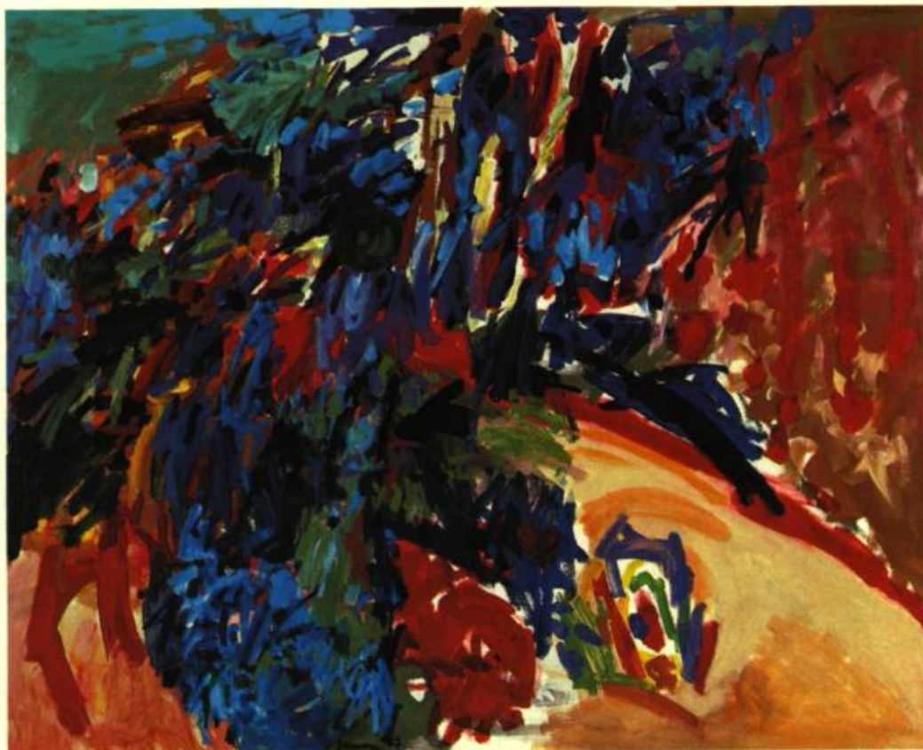
3. Pierre GAUVREAU Cœur de barbarie , 1977. Huile sur toile; 152 cm 4 x 121,9.