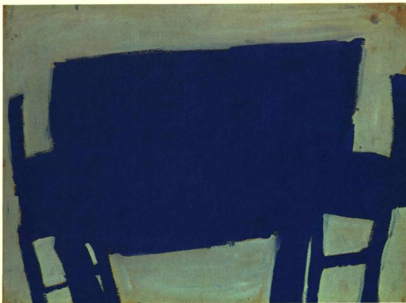
4. Michael SNOW Blue Table & Chair , 1957. Gouache sur papier; 45 cm 7 x 60,3.