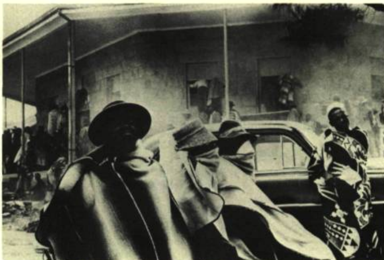
5. Ian BERRY Lieux et visages.

La somptueuse installation de Marthe Wéry venait accréditer l'idée que les tableaux monochromes sont loin d'avoir livré tout leur message sur la peinture et que les couleurs les plus envoûtantes ne sont pas nécessairement les plus voyantes. Intitulée Peinture Montréal 84 , l'œuvre bleue – après la rouge de Peinture Venise 82 – redisait aussi combien un travail purement rythmique peut devenir un mode d'appropriation très efficace d'un espace spécifique pour peu qu'on en fasse pleinement l'expérience, c'est-à-dire qu'on y déambule les yeux grands ouverts.