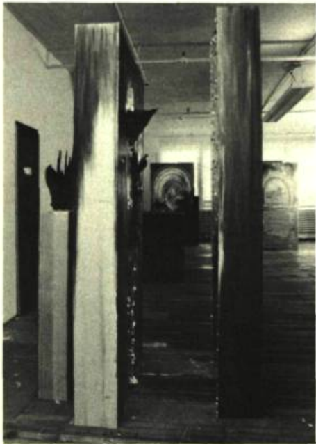
3. Jocelyne ALLOUCHERIE Dessin-installation.