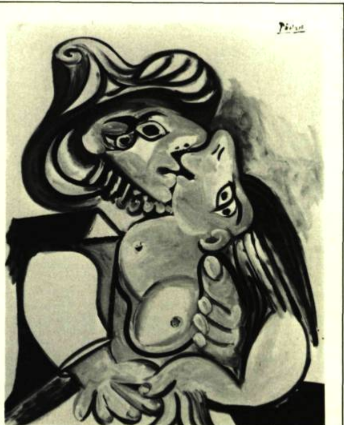
7. Le Baiser , II, 1969. Huile sur toile; 146 cm x 114. Bâle, Galerie Beyeler.