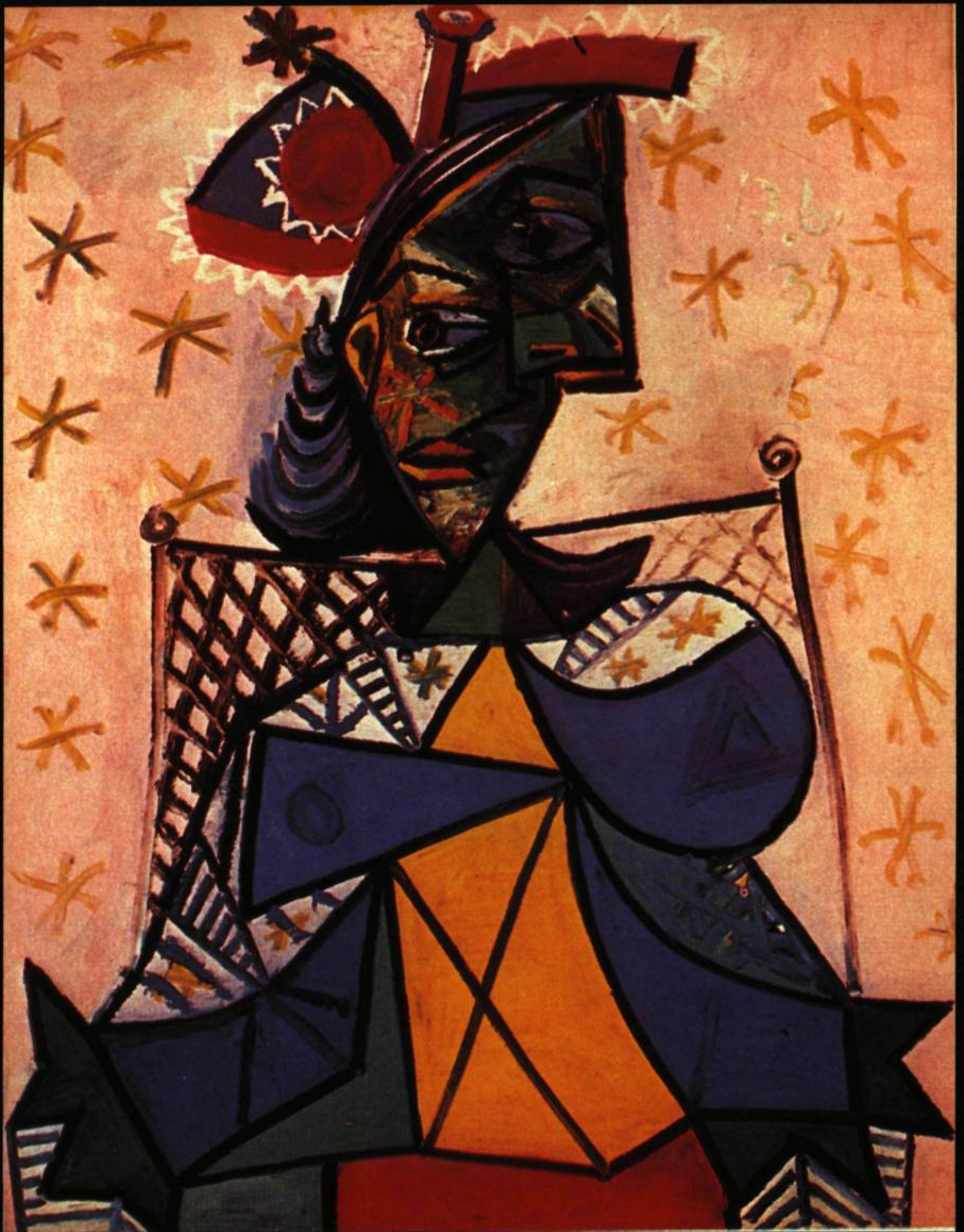
2. Femme assise au chapeau bleu et rouge, 1939. Huile sur toile; 92 cm x 73.