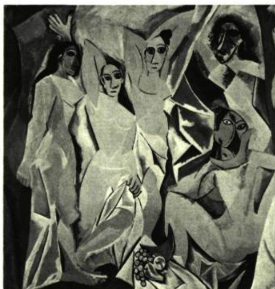
3. Les Femmes d'Alger , 1907. Huile sur toile; 244 cm x 233. New-York, Musée d'Art Moderne.

L'art est posé dans l'altérité en tant que plasticité et désir. (Jean-François Lyotard)