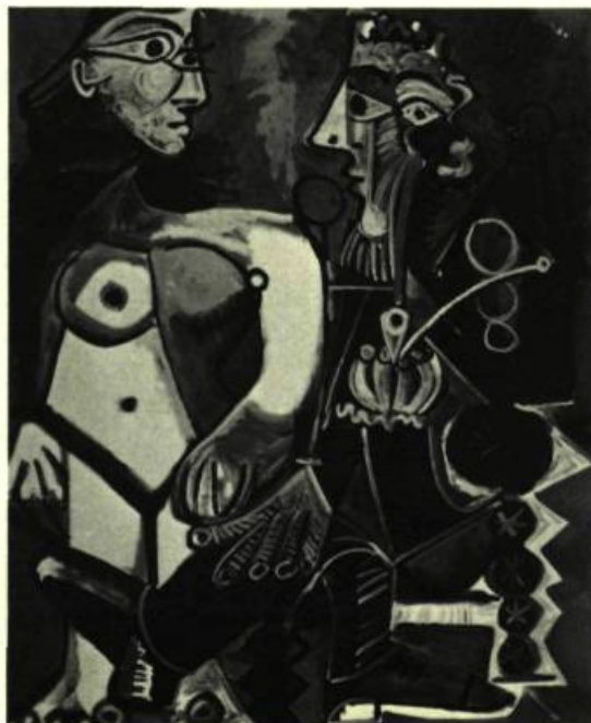
4. Nu et fumeur, 1968. Huile sur toile; 162 cm x 130. Lucerne, Galerie Rosengart.

To understand thoroughly the stake of what operates in Picasso's work demands a change in the manner of examination. Leo Steinberg 4 opened the way to this by bringing out all the implicit eroticism contained in the very structure of Les Demoiselles d'Avignon , analysed too often in strictly formalist terms. These elements are almost always underlying, and it is useful to emphasize their presence, even if the work periodically slips sideways, whether it be in the direction of the decorative or of the burlesque or of the tragicomic. Picasso, who explored in turn all the facets of the figural, did not see as a contradiction the passing over of the metamorphosis of the body/figure, from the lyric to the monstrous. It was then that he disarticulated the figure to the greatest degree and recomposed it by introducing disproportion between the members and displacements of organs, as can be seen in Femme assise au chapeau plat of 1945 (Fig. 6). In spite of a certain geometrization of the trunk, this work must be interpreted otherwise than as a simple variation of formal procedures perfected during the cubist period. The treatment of the face is doubtless the most noted signifier. To