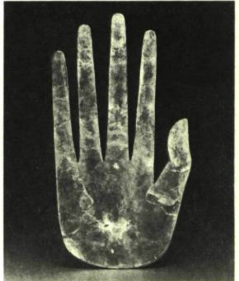
Hand-Shaped Cutout, Culture Hopewell

Jusqu'au 14 juillet: De Léonard de Vinci à Vincent Van Gogh - Dessins du Musée des Beaux-Arts de Budapest; A partir du 28 juillet: Dessins de maîtres du 15 e au 20 e siècle de la Collection Baer; Jusqu'au 4 août: Art ancien des Indiens de l'Amérique du Nord de 3,000 av. J.-C. à 1,600 ap. J.-C.; Jusqu'au 2 septembre: La Sculpture indienne, de 3,000 av. J.-C. à 1,300 ap. J.-C.; Une Galerie royale, Peintures anciennes de Dulwich; A partir du 22 septembre: Gravures modernes allemandes de la Collection Jacob et Ruth Kainen.