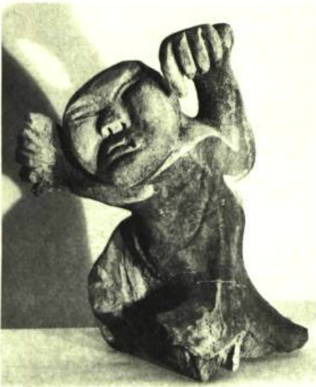
OKANGOT, Repulse Bay

Juillet: Sculpture en os de baleine de l'Arctique; Août: Sculpture inuit; Septembre: Jeux ajagaks et esquimaux.