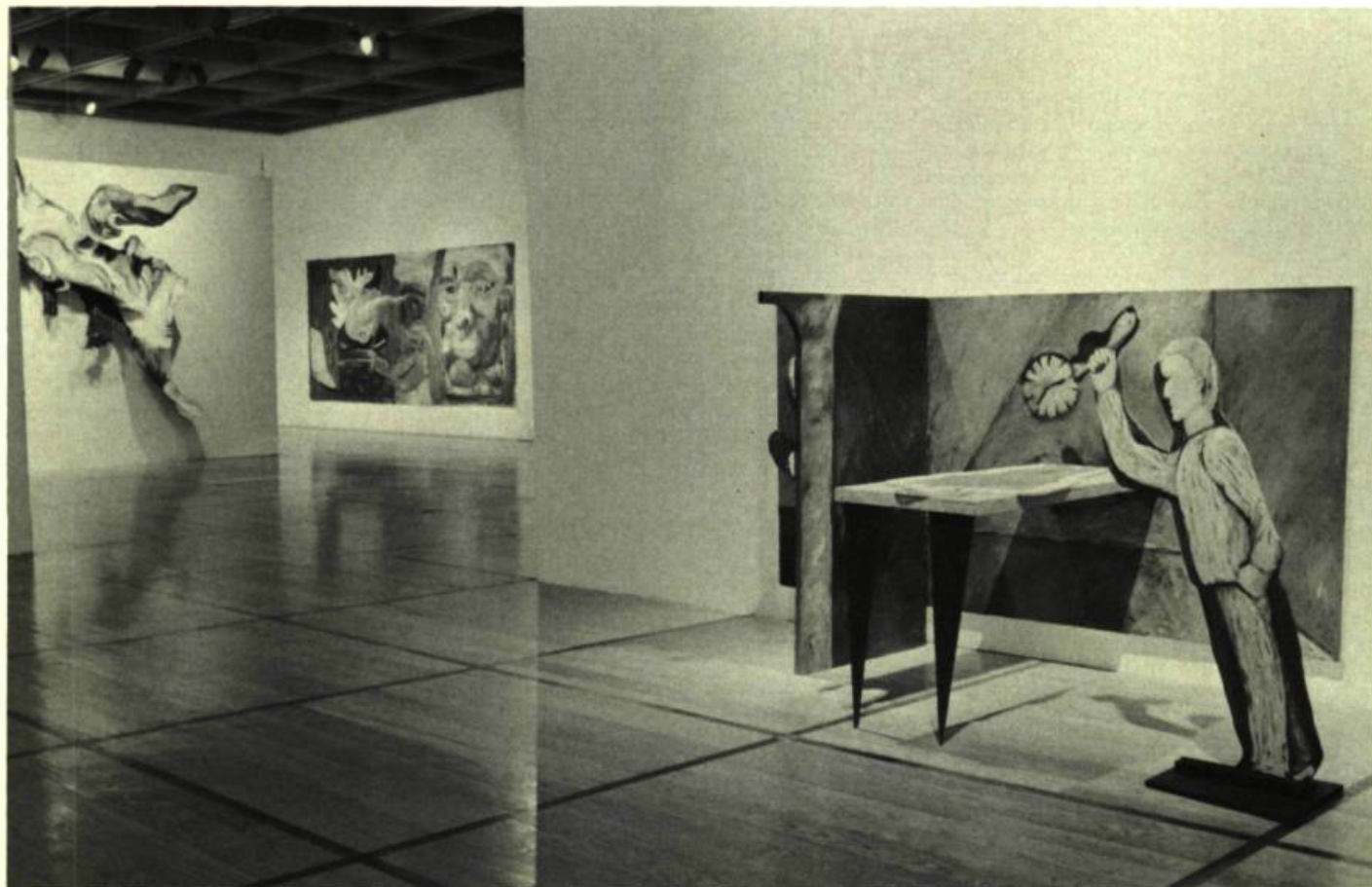
5. Vue partielle de l'exposition, 1 er plan: Ilana ISEHAYEK; 2 e plan: Mary-Ann CUFF; 3 e plan: Lynn HUGUES.