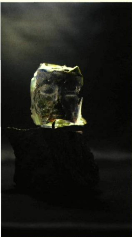
2. Masque de verre, 1966-1967. 8cm 5 x 13.