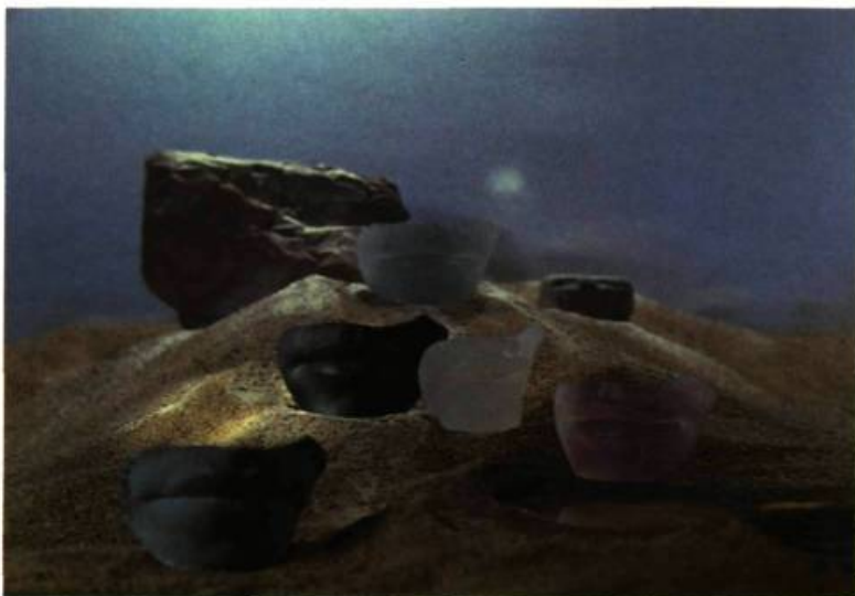
1. Maurice DEMERS. Silence monumental , 1984. 5cm x 8½.