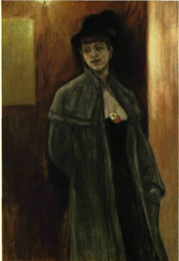
18. Félicien ROPS, La Dèche , 1882.

compose des dessins de mode. C'est un épistolier infatigable. Il entretient une correspondance suivie avec Mallarmé, Villiers de l'Isle-Adam, Flaubert, Hugo, Musset, les Goncourt – et surtout Baudelaire à qui le lie une amitié profonde (il grave pour lui le frontispice des Épaves ). Sa renommée, sans aucun doute insuffisante, Félicien Rops la doit à la beauté et à la hardiesse de ses gravures (par exemple, à cette superbe pierre intitulée L'Ordre règne à Varsovie , qui date de 1863!); cependant il est aussi un grand peintre. Ses paysages, en particulier ses bords de mer ou de fleuve, ses plages, ses ports et encore ses vues de ville ou ses scènes de genre ( Dimanche à Bougival ) évoquent cette sorte d'impressionnisme qu'on sentait poindre déjà chez Manet et Courbet: tout à la fois une sensibilité aiguë et une franchise entière de couleur. Rops, qui au vrai n'appartient à aucune école, annonce très souvent les années à venir. «Être moderne, dit Sâr Péladan, c'est avoir tout vu, tout lu, c'est avoir tout le passé présent à l'esprit... C'est sentir la spiritualité