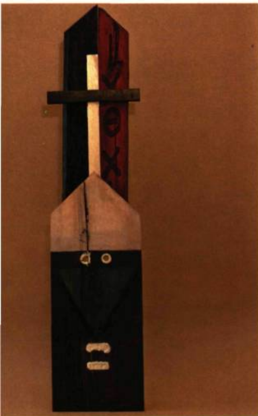
2. R. Holland MURRAY A Workshipper Mask, 1985. Bois, huile et plâtre.

veloppement de l'art moderne. Témoin ou modèle? Aujourd'hui, on s'interroge plus sérieusement sur l'idée d'affinité, sur celle d'influence. Bref, on commence à parler de confluences. Dans un tel contexte, le fait que l'exposition Masks, de Robert Holland Murray et Russel Gordon, ait rencontré un écho aussi positif en s'inté-