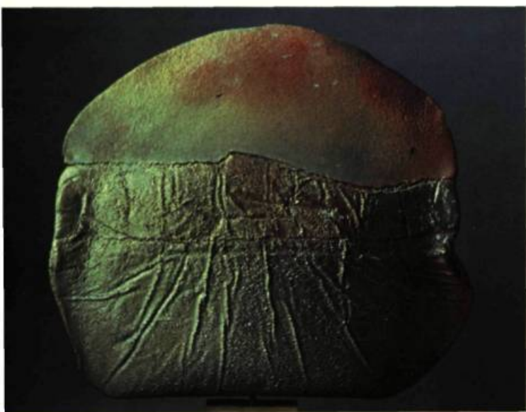
2. Feuille de chair. 45 cm x 38.