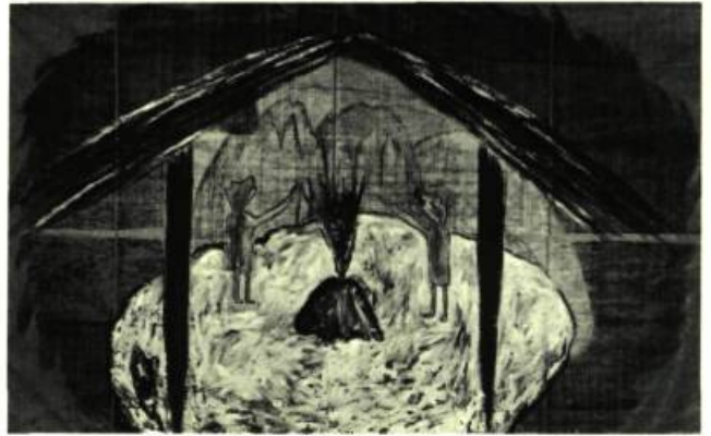
12. Roger PILON La Maison bleue . Acrylique sur bâche; 427 cm x 274. Montréal, Galerie Oboro.