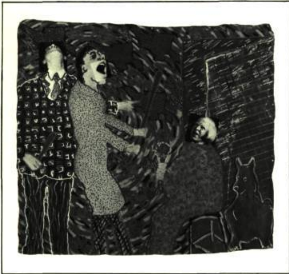
11. Luc BÉLAND Combinatio: Double Bind (2 e version, selon James Ensor), 1984. Sérigraphie et techniques mixtes sur toile; 188 cm x 210. Montréal, Galerie Graff.