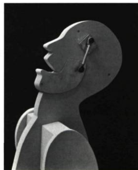
15. Jonathan BOROFSKY Chattering Man (détail)