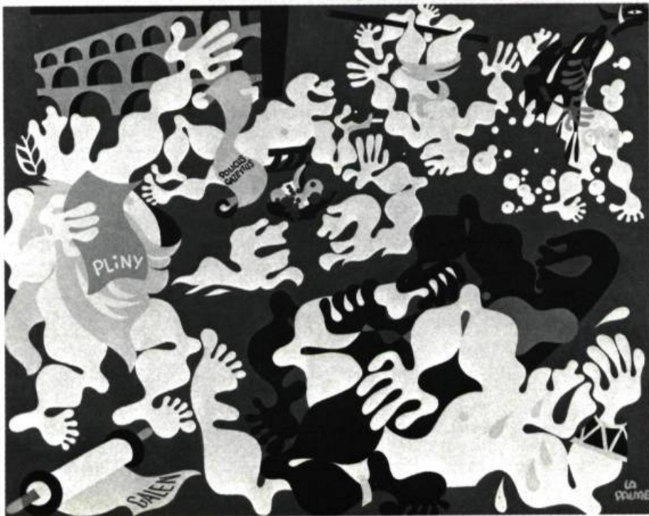
3. Sans titre.