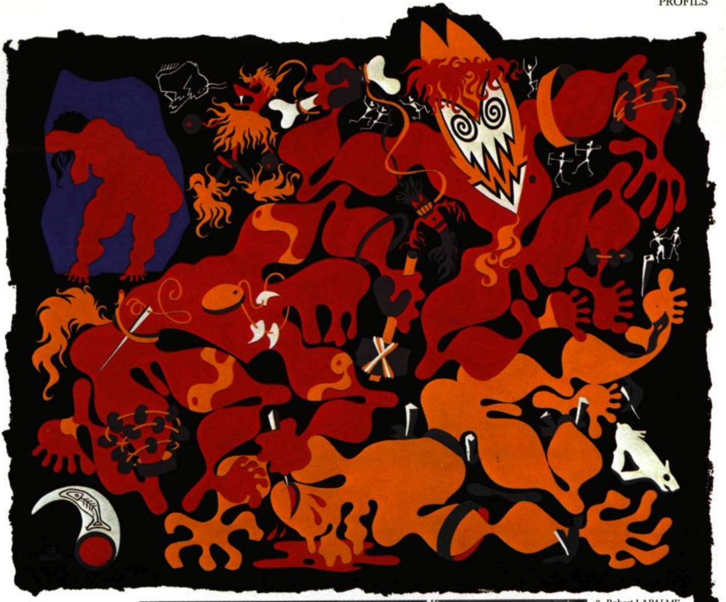
2. Robert LAPALME Sans titre.