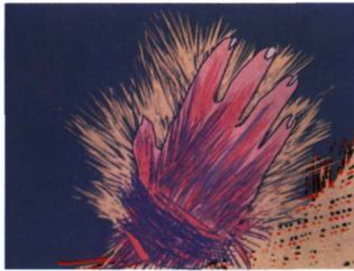
2. TELEFERIC, La main du futur , 1986.