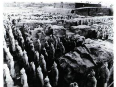
Excavation de la tombe de Qin Shijiang, 1 er empereur de Chine, 221 à 207 av. J.-C.

MUSÉE DE PHILADELPHIE, Angle de Parkway et de la 26 e Rue. Du 22 mars au 24 mai: Sculptures en céramique chinoises; A partir du 11 avril: Photographies sur la vie américaine contemporaine; Jusqu'au 17 mai: Design, de 1900 à 1940.