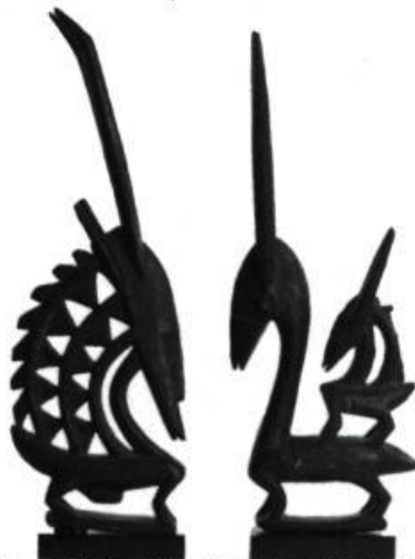
Sculpture africaine de la Coll. Justin et Elisabeth Lang

CENTRE D'ART AGNES ETHERINGTON, Université Queen. Du 22 mars au 17 mai: Carol Marino, Photographies; Jusqu'au 19 avril: Sélections de la Collection Gordon Glass; Jusqu'au 3 mai: Sculptures africaines de la Collection Justin et Elisabeth Lang; Jusqu'au 10 mai: Augustus John, Travaux graphiques de la Collection permanente; A partir du 17 mai: L'Art de l'aquarelle à travers la Collection permanente; A partir du 24 mai: Ron Headland; Jusqu'au 31 mai: L'Art abstrait canadien de la Collection permanente.