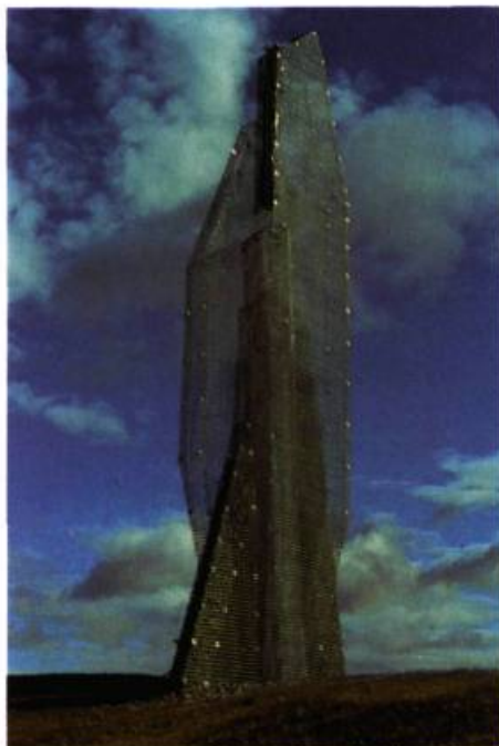
2. Scottish Sculpture Open 3, Kuldrummy Castle, 1985. Grillage métallique et pierre concassée; 320 cm x 120 x 110.

L'utilisation du grillage en sculpture lui permet de retrouver les hachures croisées de ses dessins. Il gagne aussi la liberté de construction. L'assemblage permet une conquête de l'espace en captant le temps dans ses filets. Il matérialise la lumière en jouant sur les oppositions entre mat et brillant, plein et vide, intérieur et extérieur, réel et virtuel. L'aspect de mailles dilatées du matériau permet la transparence. Selon la lumière, les formes se dissolvent dans l'environnement, l'espace renfermé paraît imaginaire. Créateur avant tout, son langage plastique ne correspond pas aux ten-