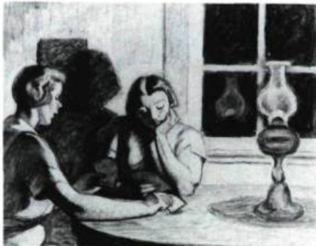
John LYMAN (Phot. Larry Ostrom) Coll. Paula et Danny Bercovitch

LONDON REGIONAL ART GALLERY, 421, rue Ridout Nord. Jusqu'au 14 juin: Nick Johnson; Du 19 juin au 2 août: La Guilde des Poters de London, Ontario; Jusqu'au 6 juillet: L'Art et l'eau; Du 10 juillet au 16 août: John Lyman, Rétrospective; Du 13 juillet au 13 septembre: Les Artistes de London, Ontario; Du 28 juillet au 30 août: Le 100 e anniversaire de naissance de Marcel Duchamp; Jusqu'au 30 août: 75 e anniversaire de l'H.B. Beal Technical School; A partir du 4 septembre: Ian Carr-Harris, Moving Images ; A partir du 5 septembre: Henry Hines, Photographies sur London, Ontario, de 1905 à 1930; A partir du 12 septembre: Clark McDougall, Rétrospective.