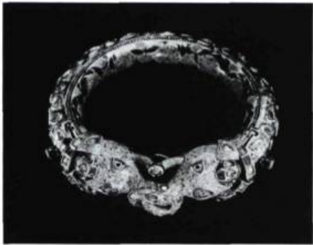
Bracelet éléphant, Indes

MUSÉE DES BEAUX-ARTS DE L'ONTARIO, 317, rue Dundas Ouest. Du 27 juin au 6 septembre: Jessie Oonark, Rétrospective; Jusqu'au 28 juin: Joyce Wieland, Rétrospective; Jusqu'au 12 juillet: Betty Goodwin, Acquisitions récentes de gravures et de peintures; Du 18 juillet au 13 septembre: Thomas Rowlandson, Gravures et aquarelles; Du 18 juillet au 27 septembre: David Salle; A partir du 24 juillet: France Loring (1887-1968) et Florence Wyle (1881-1968), Rétrospective de sculptures.