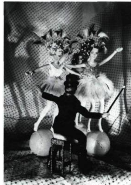
Ellen BROOKS Coll. Musée d'Art Contemporain de Montréal

GALERIE WALTER PHILLIPS, Centre Banff. Jusqu'au 14 juin: La Magie de l'image ; Du 19 juin au 19 juillet: Wild Rose Country (artistes de l'Alberta); Du 24 juillet au 14 août: Les Artistes en résidence du Centre Banff, Céramiques, peintures, textiles et sculptures; Du 4 au 30 août: Vidéo Theatrics .