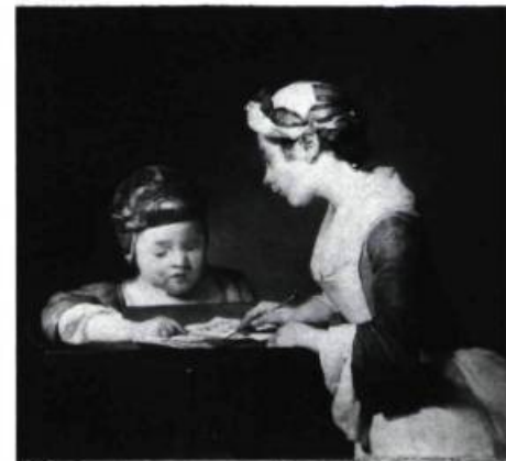
Jean-Baptiste Siméon CHARDIN

THE NATIONAL GALLERY, Trafalgar Square. Du 17 juin au 16 août: Lucien Freud, Le Regard de l'artiste .