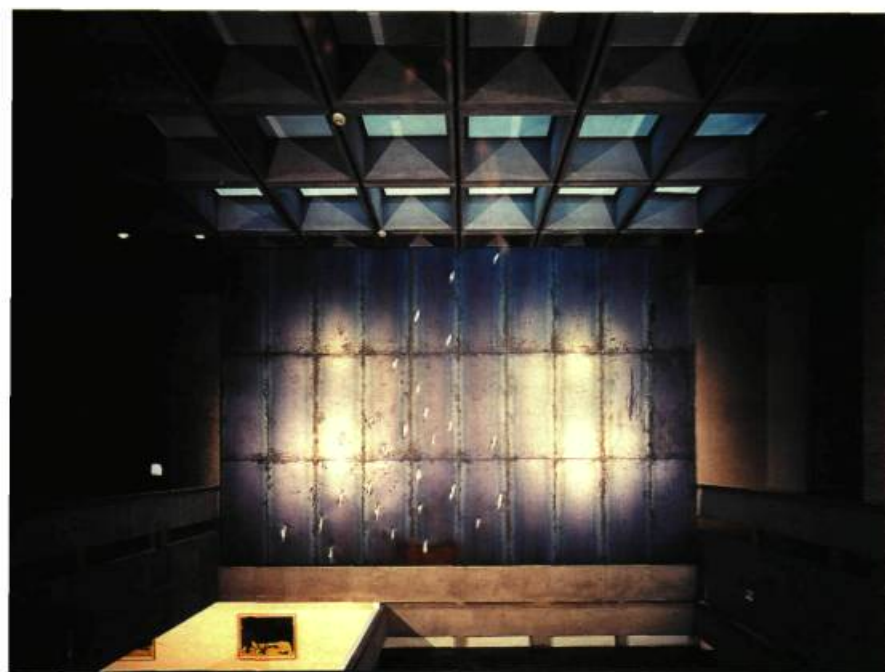
Sans titre, 1986. Acier, plâtre et plomb; 600 x 900 cm. Coll. Jannis Kounellis.

En ce qui concerne les éléments, le châlit qui recevait le charbon en 1967 peut maintenant redevenir un cadre, comme les sacs de toile sont redevenus une simple matière naturelle tendue. Sur le plan symbolique, s'il existait des relations de cause à effet entre le charbon et le feu dans les années 60, malgré qu'ils n'ont jamais été employés dans un ensemble, un autre côtoïement a pris forme depuis 1985: celui du feu et du bois. Le bois, qui fit son apparition au moment où les animaux vivants ont presque disparu, affirmant en cela son côté mou, sa part organique.