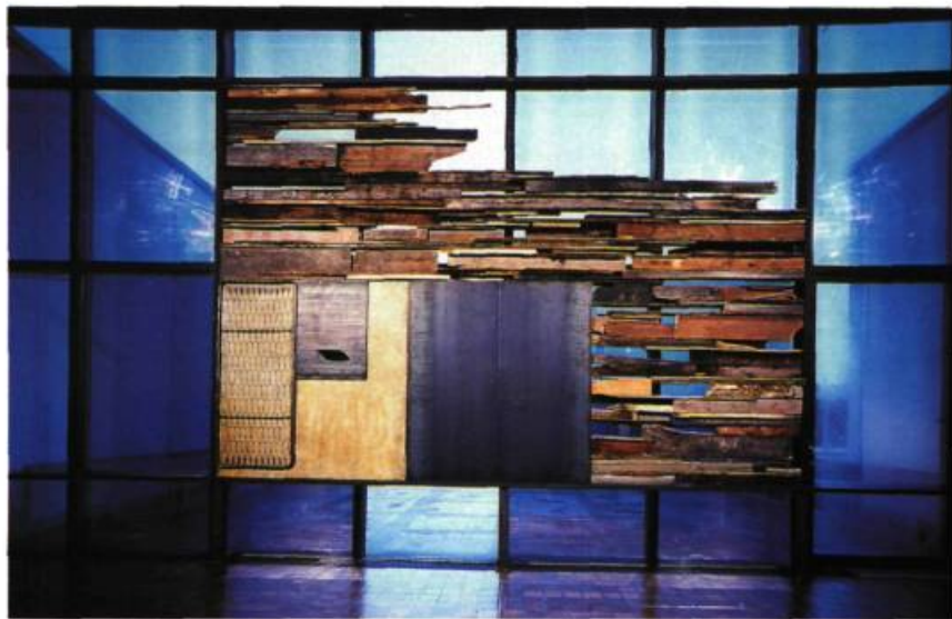
Sans titre, 1985. Acier, bois et encaustique; 410 x 586 cm. Coll. S. Dakis Ioanov, Athènes.

l'image plane de la peinture. On pourrait alors identifier cette œuvre récente, réinstallée au Musée d'Art Contemporain de Montréal, comme un mur, tellement elle fait obstacle au regard, surtout qu'elle fait face à une autre œuvre qui, elle aussi, empêche notre regard de traverser le fenêtrage et ainsi percevoir la ville. De plus, on peut interpréter les nombreuses entailles de