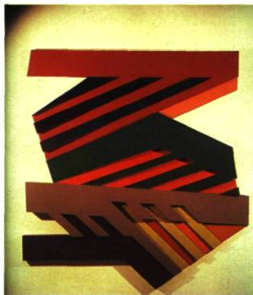
Frank Stella Piaski III , 1973. Techniques mixtes; 223,8 x 213,5 cm. Coll. Brigitte Freybe, Vancouver Ouest.

Quiconque regarde une œuvre de Frank Stella datée de 1960 et un de ses tableaux récents peut bien croire à des signatures différentes. Stella n'est pas l'homme d'une formule ou d'une recette dont seul l'apprêt varierait. Son itinéraire artistique a pour bornes des virages radicaux et des sauts novateurs. A l'instar de l'auteur Nathalie Sarraute, il pourrait déclarer: «Ma seule constante est le changement.»