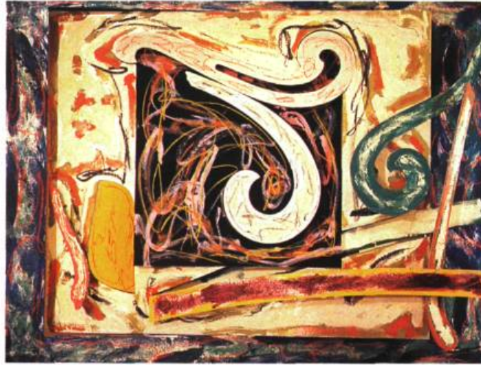
Steller's Albatross , 1976. Techniques mixtes; 196,35 x 217,3 cm. Coll. Henry et Maria Feiwel