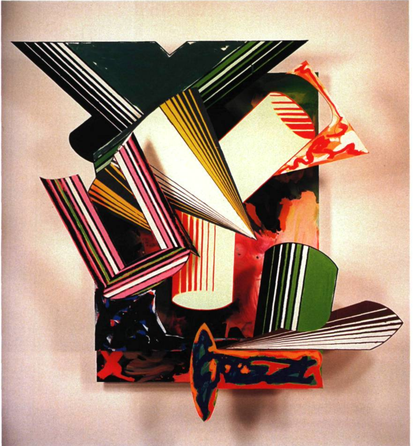
Lo Sciocco senza paura , 1985. Techniques mixtes sur toile; 320 x 299,1 x 52,7 cm. Musée d'Art Moderne Kawamura, Sakura, Japon.