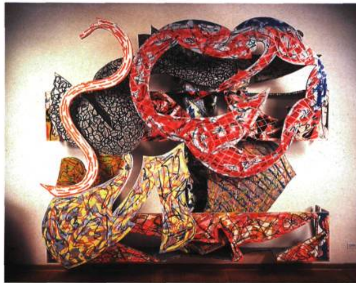
Zandvoort , 1981. Techniques mixtes; 274,4 x 315 x 50,8 cm. Coll. Donald et Barbara Zucker.