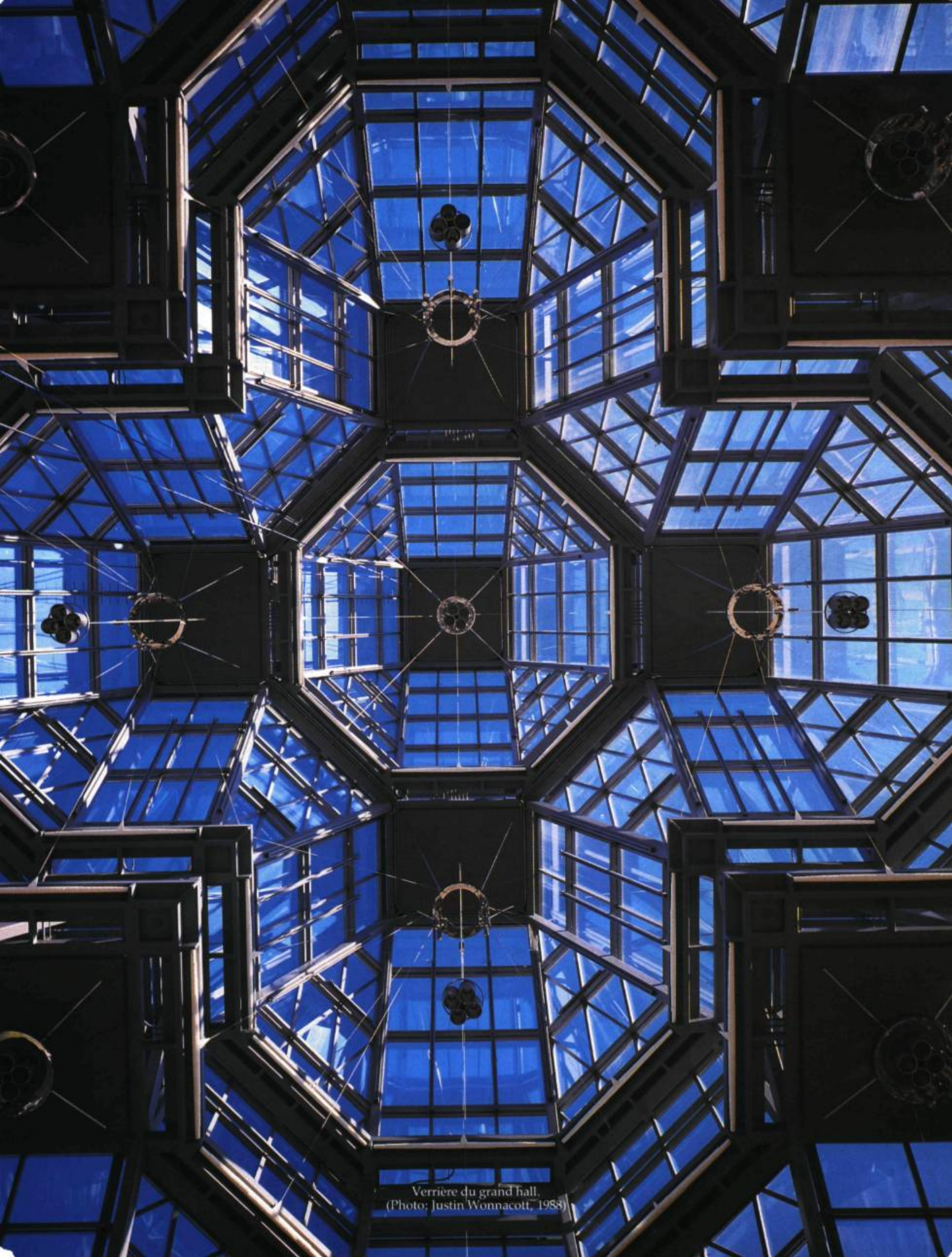
Verrière du grand hall.