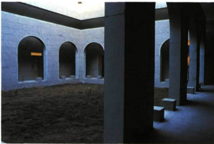
Cour intérieure. (Photo: Justin Wonnacott, 1988)