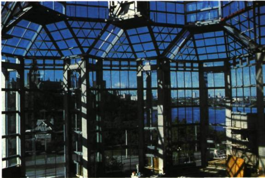
Vue sur le Parlement à partir du grand hall. (Photo: Justin Wonnacott, 1987)