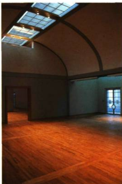
Galleries d'art canadien. (Photo: Justin Wonnacott, 1988)

Paris et, après Ottawa, au Metropolitan Museum de New-York (voir l'article de René Viau à la page 29).