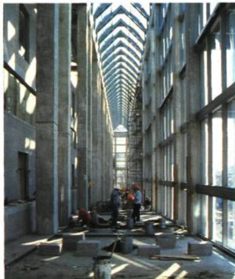
Rampe vitrée menant au grand hall.

fondé avec l'obligation de collectionner l'art canadien, a acquis systématiquement, au fil des ans, plus de 10.000 œuvres d'artistes canadiens – le quart de sa collection globale.