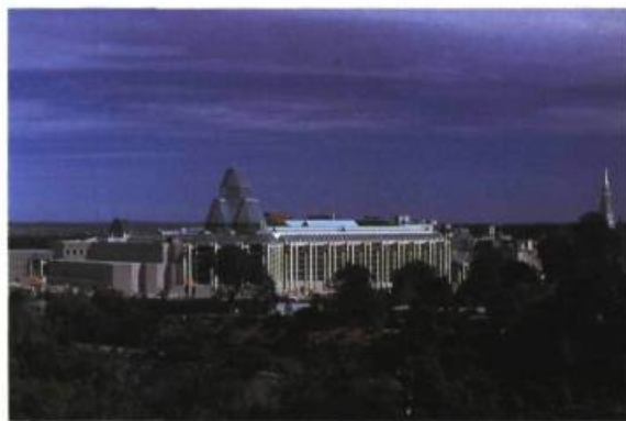
Vue d'ensemble.

Les rappels abondent dans le nouveau musée mais, si Safdie intègre par exemple une cour intérieure aux accents romans, «c'est parce que, remarque-t-il, l'architecture romane est pénétrée de calme. Il en émane la même sensation de quiétude que dans les salles du musée, aux antipodes des espaces publics où règne une activité intense.»