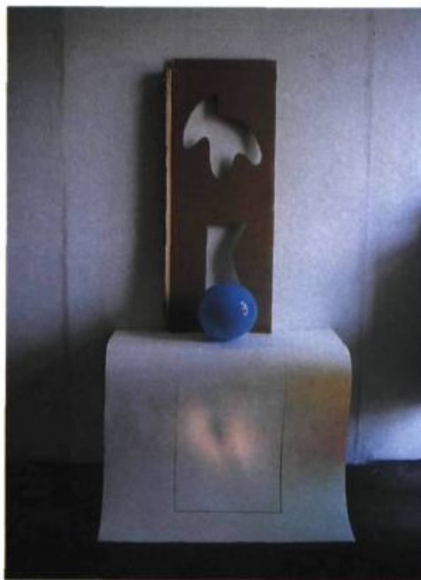
Nature morte aux sphères (détail), 1986. Photographie en couleur.

Comment retrouver le fil conducteur qui relie des éléments comme le carton alvéolé, le cube, la sphère, le chandelier, le drap ou encore le fil de métal?