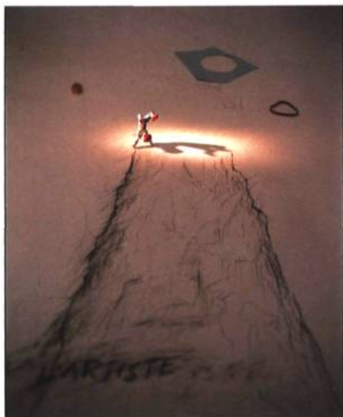
L'Artiste , 1986. Photographie en couleur; 107 x 132 cm.

Mais ce qui intéresse peut-être davantage dans cette œuvre, c'est la référence au bouffon, à ce personnage utilisé si fréquemment en art moderne, où il fait figure d'autoportrait. Je crois que s'il y a un autoportrait à trouver dans cette œuvre, il est sans doute moins dans les caractéristiques du personnage (agile, vif, volubile, séducteur), que dans sa position précaire, en équilibre près du précipice, position d'autant plus courageuse, qu'il ne peut qu'avoir conscience, à travers son travail d'artiste, de la fragilité souvent troublante qui s'attache à la nature illusoire de l'art. ■