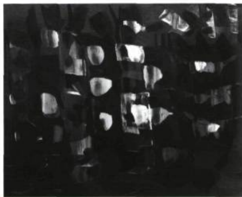
Paul-Émile Borduas La Pâques Nouvelle , 1948. Huile sur toile; 30,5 x 38,1 cm.

L'Université Concordia projette, depuis de nombreuses années, la construction d'un nouvel édifice logeant enfin une bibliothèque adéquate à un milieu universitaire. Les plans prévoient un espace d'exposition important ce qui permettrait de rendre la collection plus accessible. Pendant que l'Université se heurte à des délais et à des tracasseries gouvernementales, qu'il nous soit permis de rêver avec elle.