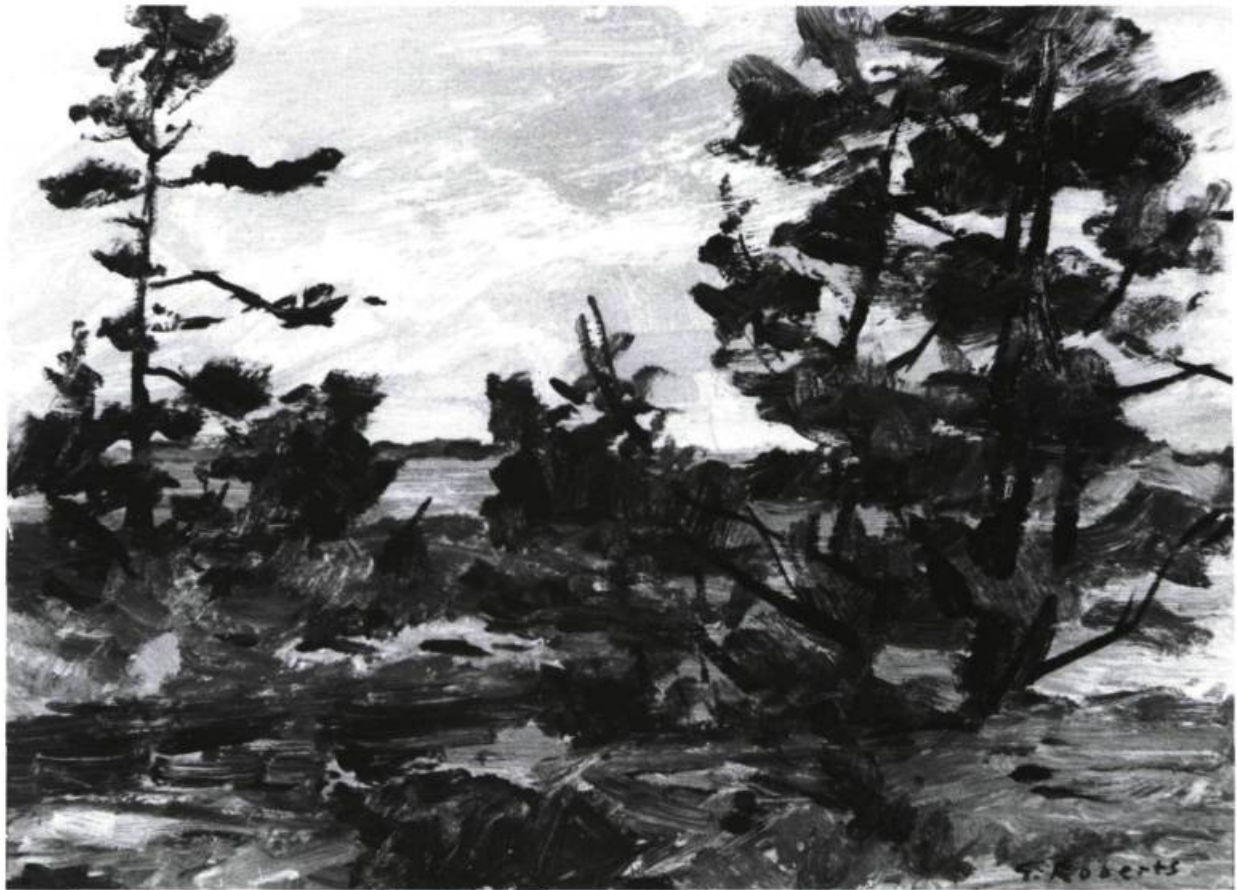
Goodridge Roberts Georgian Bay , 1962. Huile sur masonite; 30 x 40,6 cm.