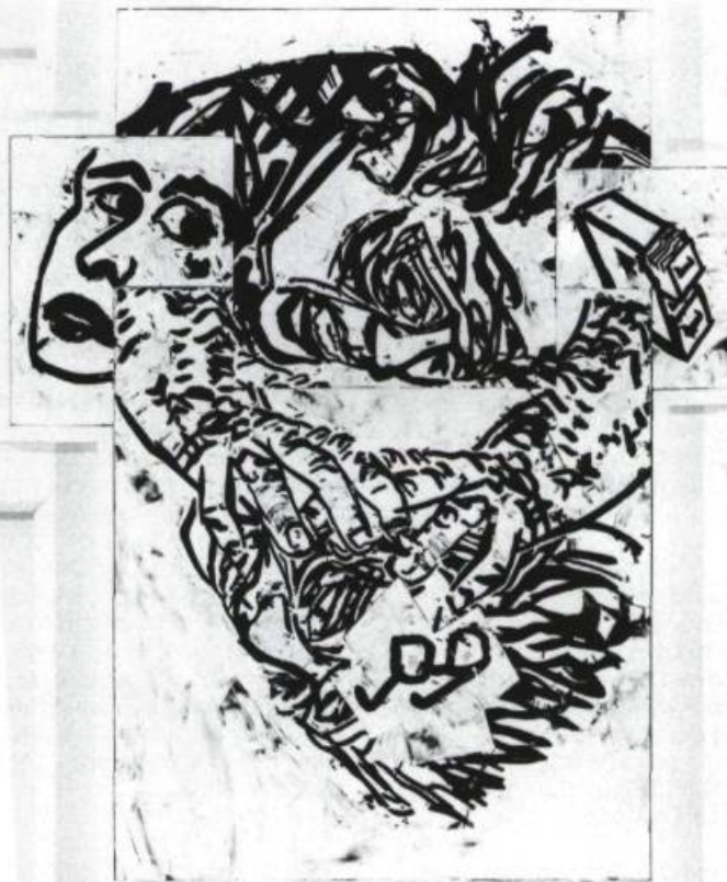
David Craven No excuses – No Apologies , 1985. Techniques mixtes; 119 x 103 cm.