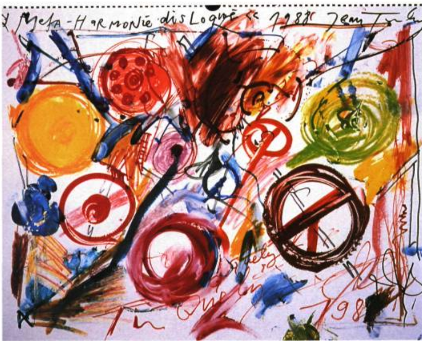
Méta harmonie disloquer , 1987. Techniques mixtes; 36 x 48 cm. Paris, Musée d'art moderne

Parmi les créateurs de sa génération, Tinguely, découvre-t-on, pressent tout autant la situation artistique d'une époque que les problèmes économiques, politiques et sociologiques de la seconde moitié du siècle. Il le fait d'une façon sarcastique et émotive mais avec une alliance rare de l'intelligence et de la justesse. Avec sa découverte de Duchamp, de Malévitich, de Kandinsky et de Schwitters, Tinguely prolonge les prémices d'une œuvre basée sur la transfiguration du déchet, l'utilisation du son et du mouvement ainsi que la réflexion par le dessin, une œuvre, pourtant pas si éloignée du surréalisme, se révélant dans l'antinomie vie et mort, mouvement et arrêt. «Tinguely incarne», d'écrire Pontus Hulten, «avec quelques artistes européens de sa génération la quasi-totalité de ce siècle. C'est-à-dire qu'il y a en lui la tradition d'avant-garde de l'entre-deux-guerres et l'utopie et la pureté d'esprit qui ont existé dans cette tradition, spécialement l'esprit dada mais aussi l'esprit constructiviste, et le postmoderne ne semble pas avoir de secrets pour lui.» ■