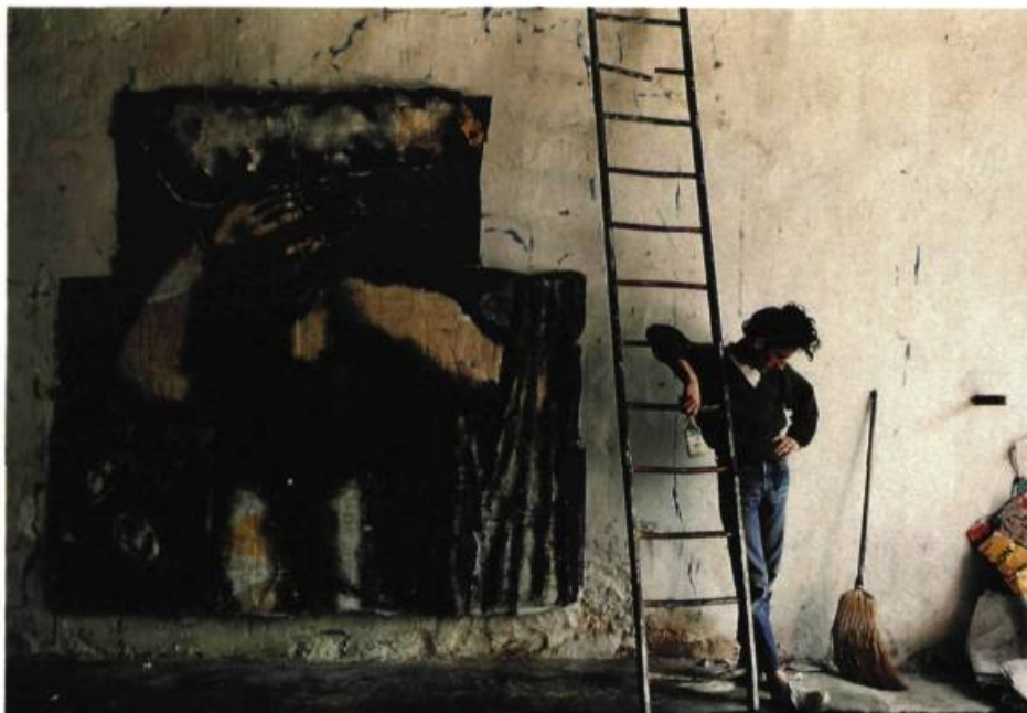
Jean-Charles Blais Peinture fraîche , 1985. Film d'Heinz Peter Schwerfel.

On n'oubliera pas de sitôt des films aussi forts que ceux de Didier Baussy qui sont des œuvres au sens propre du terme: outre son Picasso , son Pierre Bonnard - Les aventures du nerf optique , et plus encore son Le Tintoret d'après Jean-Paul Sartre ou La déchirure jaune , qui propose un discours articulé sur l'art tout en manifestant un savoir-faire cinématographique, rehaussé ici par une utilisation pertinente de la louma . Incidemment, plusieurs de ces films marquants sont présentés en compéti-