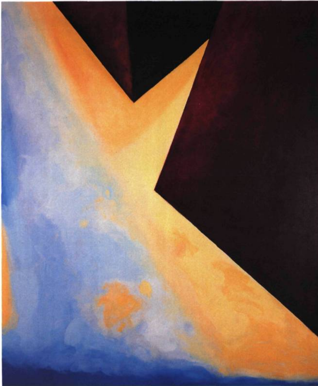
Illusion , 1988. Acrylique sur toile.

viste, la télématique les transmet à qui en fait la demande. La télématique permet d'établir le contact, de le maintenir et de l'activer.» L'installation renforce ce contact puisqu'il permet au regardeur d'assister à la transformation de l'espace et de voir progresser le travail de l'artiste.