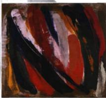
Vénitienne , 1989. Acrylique sur toile; 172,7 x 193 cm.

C'est en 1975, l'année où elle représenta le Canada au Festival international de la Peinture, à Cagnes-sur-Mer, que j'ai vu, pour la première fois, des œuvres de Michèle Drouin. Elle avait exposé à Paris, dans une galerie de Montparnasse, la Galerie Galatée, un ensemble de tableaux aux couleurs vives, sortes de ballons flottant dans l'air, ludiques un peu, à la Miró.