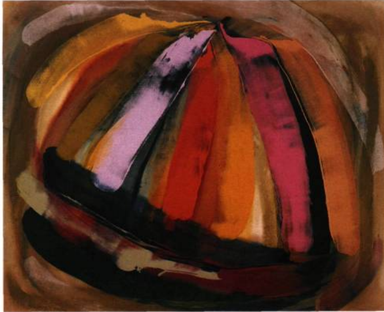
Le Départ de l'Atalante , 1989. Acrylique sur toile; 170,2 x 226 cm.

tion, d'optimisme, de pistes brouillées et de féminité absolue". Ainsi éclairée, l'œuvre me dévoila ses mystères. «vois ma joie, qui n'est pas surfaite mais sage, semblait dire le tableau, car j'apprends à celle qui me peint à former son écriture