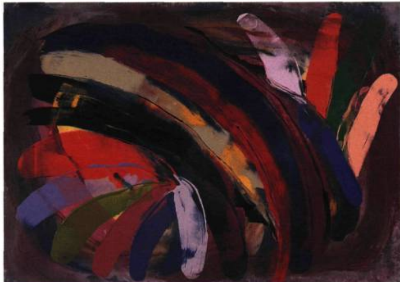
Nuit africaine , 1989. Acrylique sur toile; 120,7 x 169 cm.

lections canadiennes et étrangères; elle fait régulièrement partie des importantes expositions à thème, telles Les Femmeuses, et, au printemps dernier, Déplacements à la Maison des arts de Laval; elle a été plus d'une fois l'invitée