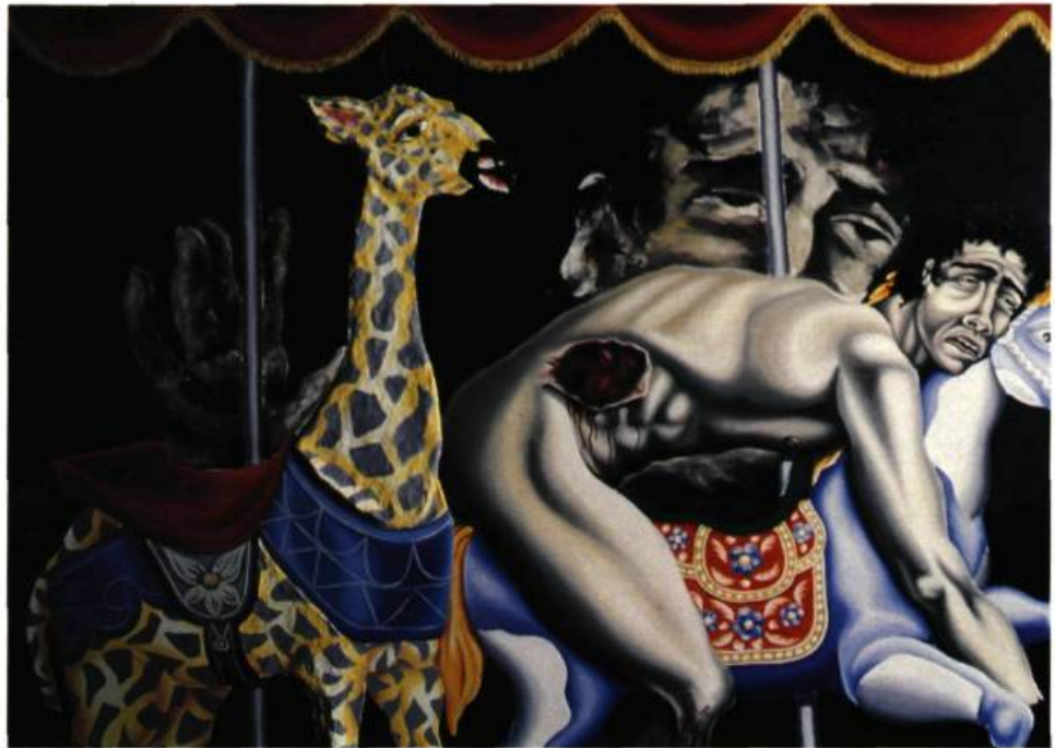
Agustín Portillo, Saint Adrien, 1990, huile sur toile, 150 x 200 cm, Collection de Ricardo Ovalle.

Apollon, Vénus, le Christ, Saint-Sébastien, la Vierge ou le sorcier forment la troupe d'un spectacle de foire ou de revue. Acteurs, chanteurs, boxeurs et danseuses sont les idoles d'un temple