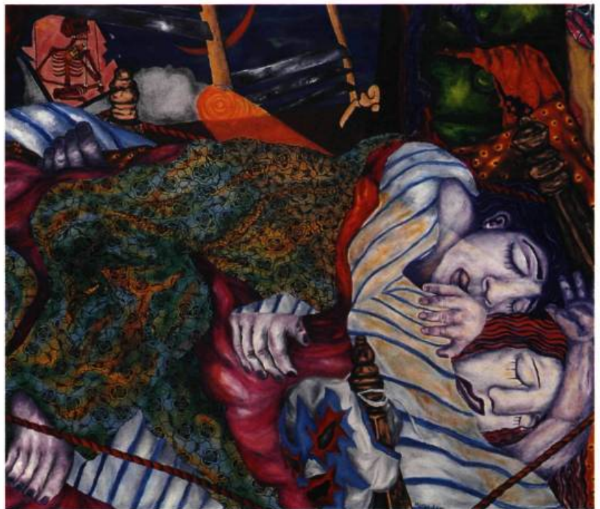
Marisa Lara, La lanterne indiscreta , 1988, huile sur toile, 110 x 130 cm, Coll. Dr. Rogelio Pereda-Miranda, Photo: Lourdes Grobet.

façon enthousiaste autant les mythes du passé que les systèmes technologiques modernes. De la ville archaïque (pré-hispanique à plusieurs égards) semblent sourdre toutes sortes de civilisations qui, malgré tout, n'en font qu'une seule. Peu importe sa dispersion géographique et archéologique apparente, chaque civilisation s'imbrique parfaitement dans l'autre. Avec ou sans folklore, typique ou pittoresque, cette recherche peut s'apparenter à celle des «Nouveaux Sauvages» ou des néo-expressionnistes allemands, sauf qu'ici, on ne vit plus un sombre, mais un étrange passé. La ville-pays, chaos-cosmos, possède certes un avenir, et même dans les pires crises, conserve son ironie. Seuls les peintres les plus jeunes peuvent, mais après coup et allégoriquement, imiter ingénument le nihilisme allemand en vogue. Bien qu'omniprésente, l'iconographie historique n'est pas omnipotente. Un morbide espoir légendaire donne lieu à l'insouciance, comme réponse aux contradictions sociales. La ville est paysage et modèle en mutation; elle est aussi le pouvoir terrestre supérieur. Tradition et modernité forment un ménage ouvert. Même le concept de la mort fait partie de