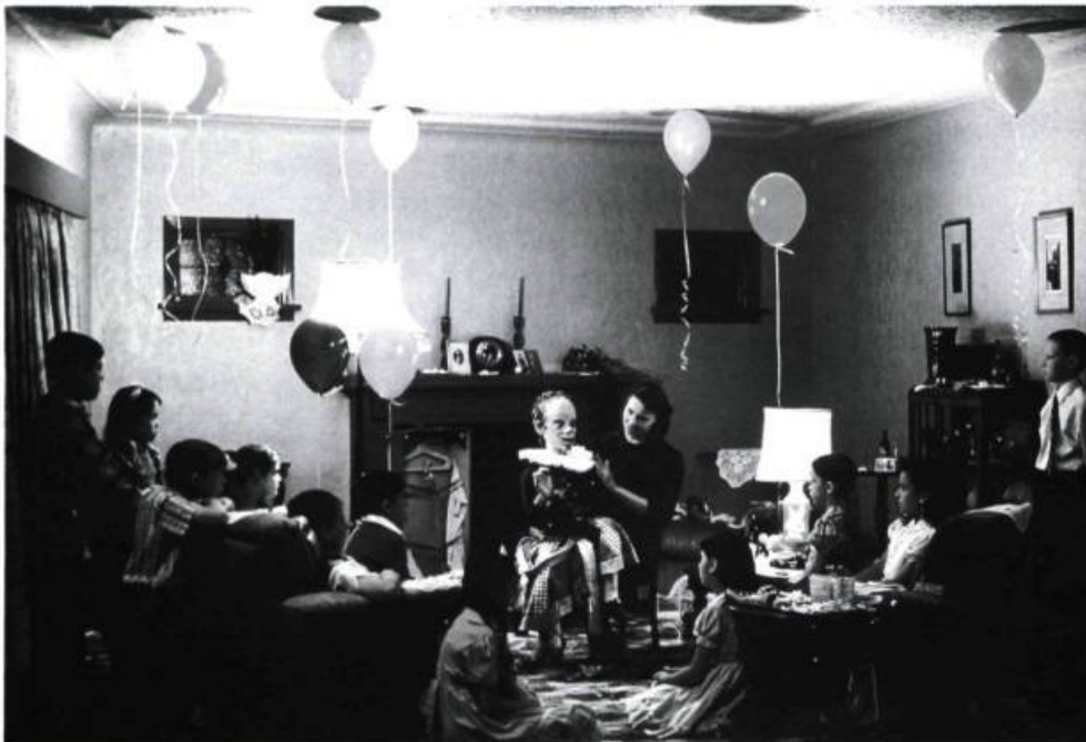
Jeff Wall A Ventriloquist at a Birthday Party in October 1947, 1990. Cibochrome transparent, fluorescents et caisson d'aluminium, 229 x 352 cm

celui-ci peut s'identifier, ce qui était privé devient public; l'histoire de l'art se mêle à celle de la vie quotidienne. Le message des Cent jours d'art contemporain 1991 est clair : l'oeuvre d'art dans l'espace public sera un des grands défis de la présente décennie. □