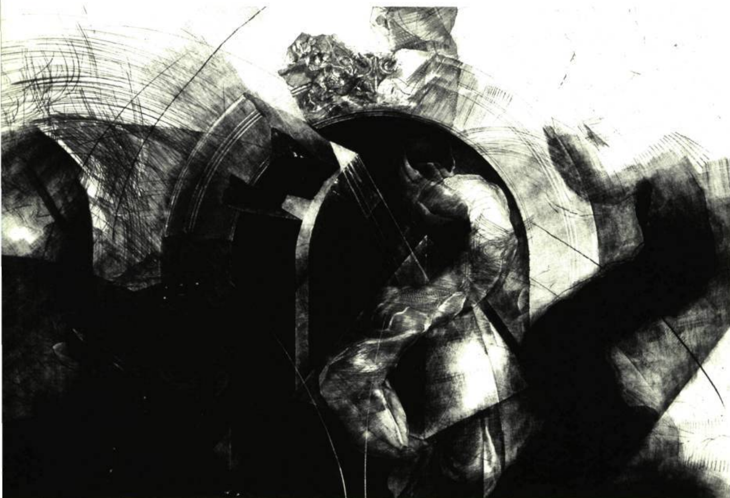
Dyptique sans titre, 1990. Manière noire, Burin et pointe sèche.

C'est ce que nous avons pu constater à l'occasion d'une de ses récentes expositions (1) . Couvrant une période allant de 1985 à 1992, les gravures présentées faisaient état de transformations que l'artiste a su imposer à la technique pour le plus grand bénéfice de sa création.