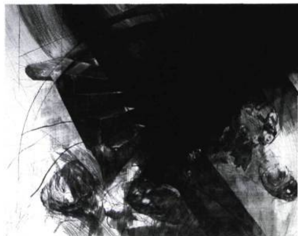
Septième lieu, 1990 Manière noire. Burin et pointe sèche.

des traits, ce qui est normalement la fonction du burin ou de la pointe sèche. L'exemple d' Opéra III est encore plus éloquent: les tracés parallèles des aiguilles du berceau s'intègrent à un dessin au trait sur une plaque qui n'a été couverte de noir qu'en partie. Ils ne sont, toutefois, pas encore libres parce qu'ils servent, en fait, à indiquer les axes de construction de l'illusion architecturale. Cette indépendance technique avait un jour, selon Pelletier, à la fois choqué et séduit un vieux maître européen du burin qui s'exclama: «C'est beau, mais il ne faut pas utiliser l'outil comme cela.» La liberté technique dont l'artiste fait preuve ne peut, néanmoins, que se concevoir comme le corollaire d'un affranchissement du réalisme pictural. Ces traits ainsi «osés» participent pleinement au jeu visuel et