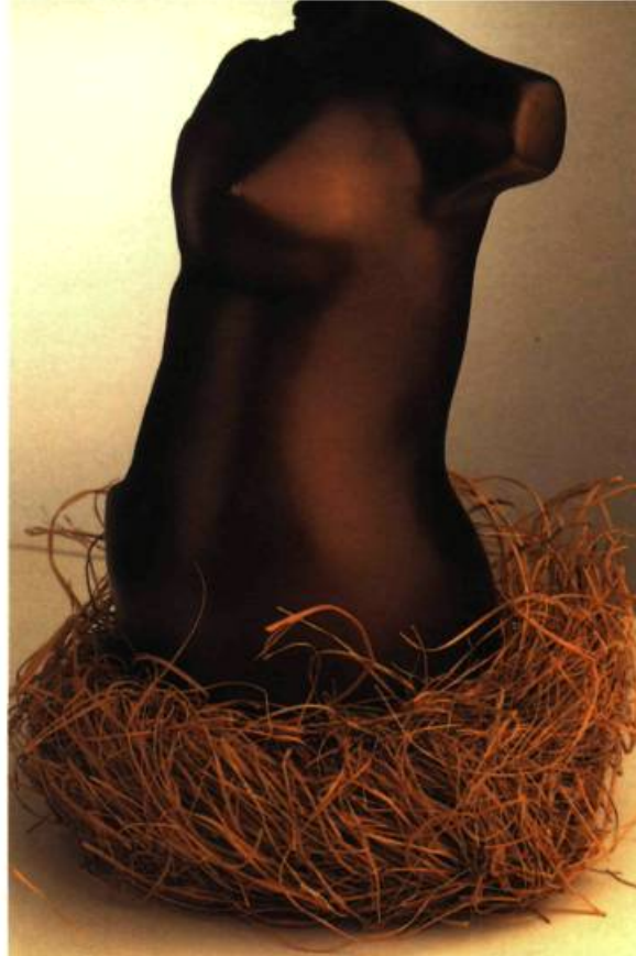
IL NIDO, 1992, bronze et foin, 21 x 16 x 14 cm.

On a pu admirer une douzaine de sculptures de bronze de Laura Santini à l'occasion de l'exposition solo que lui a consacrée, du 17 septembre au 10 octobre 1992, la Galerie d'art Landau (1456, Sherbrooke ouest, Montréal) où il est toujours possible de demander à voir ces productions récentes.