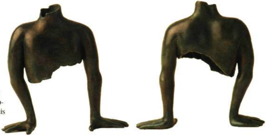
EL, 1992, bronze, 22 x 24 x 8 cm. Vue de face, Vue de dos.

En effet, n'importe quel spectateur peut constater que pour son plus grand plaisir, il reconstitue mentalement et à volonté les parties non visibles des œuvres qui s'offrent à sa vue. Ainsi par un simple effort d'attention, il répond pleinement à l'invitation permanente qui lui est lancée de combler les vides et les manques et de s'opposer à l'éventuelle chute de la pièce sculptée.