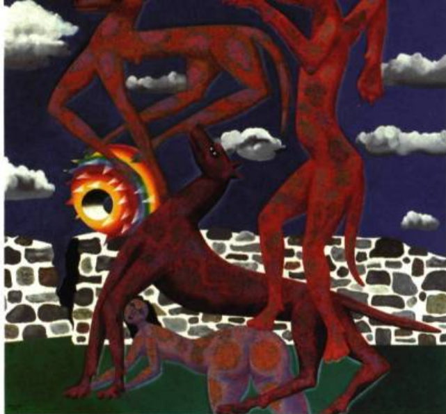
Bestiaire 25*, 1982, Huile et silex sur toile marouflée, sur contre-plaqué, 121,9 x 121,9 cm, Coll.: particulière.