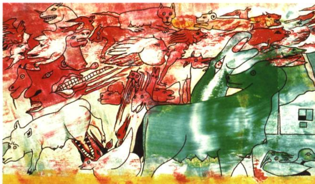
Bestiaire 5*, 1982, Huile et encre de Chine sur papier, 21,6 x 35,4 cm, Coll.: particulière.