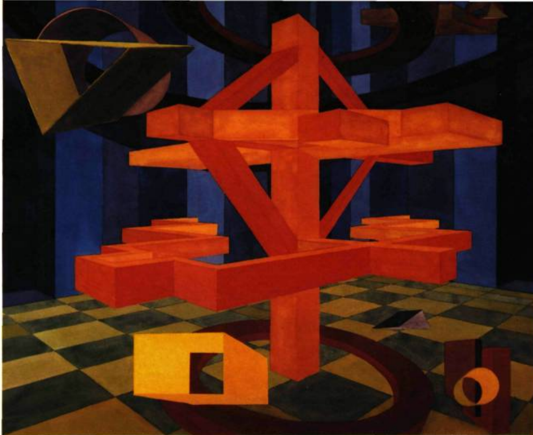
Umbria XXIV , 1992. Aquarelle montée sur châssis. 125 x 143 cm.

lointain, que d'une opposition entre devant et derrière, dessus et dessous, ultime indice de la profondeur poussée à son degré zéro et dont il fallait se débarrasser selon les tenants de la théorie moderniste de la peinture qui, au fil des décennies, auront converti la règle des peintres – celle de peindre dans le plan du tableau – en une loi historique en vertu de laquelle la peinture s'achemine inexorablement vers l'expression de son essence dans le spectacle de la pure frontalité.