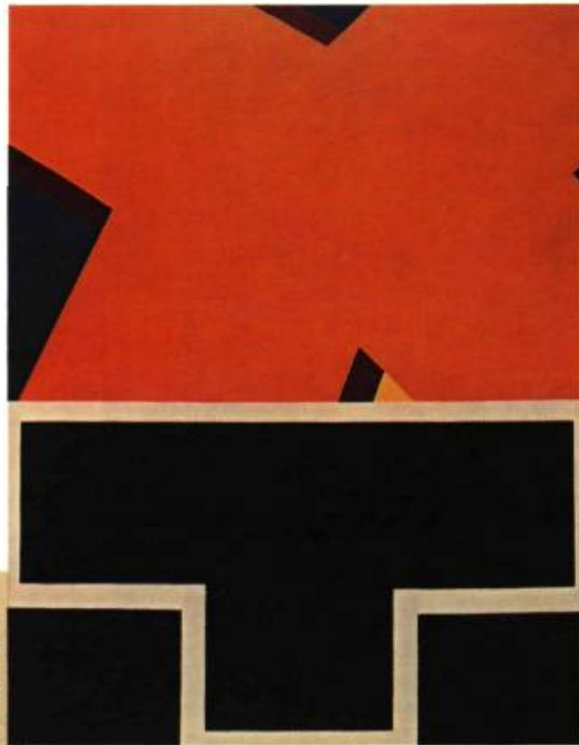
Ivan the Terrible , 1961. Acrylique sur toile, 366 x 290 cm.

Le peintre joue avec les oppositions et se joue des illusions. Par exemple, il oppose couleur et noir et blanc; dans la partie supérieure se détache en relief un X, dans la partie inférieure se dessine à plat un T; à moins que ce soit l'inverse.