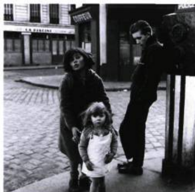
Les enfants de la place Hébert, 1957.

Curieusement, ce sont surtout les clichés pris dans les années cinquante qui rendront célèbre le travail de Doisneau dans le monde entier. Peu de personnes