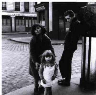
Les enfants de la place Hébert, 1957.

Curieusement, ce sont surtout les clichés pris dans les années cinquante qui rendront célèbre le travail de Doisneau dans le monde entier. Peu de personnes