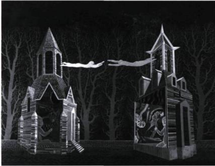
Nuit, 1982, détrempe à l'œuf vernie sur masonite, 63,5 x 81 cm.

miniatures présentée, l'automne 1991, au Mont Saint-Anne, à Beaupré, non loin de Québec.