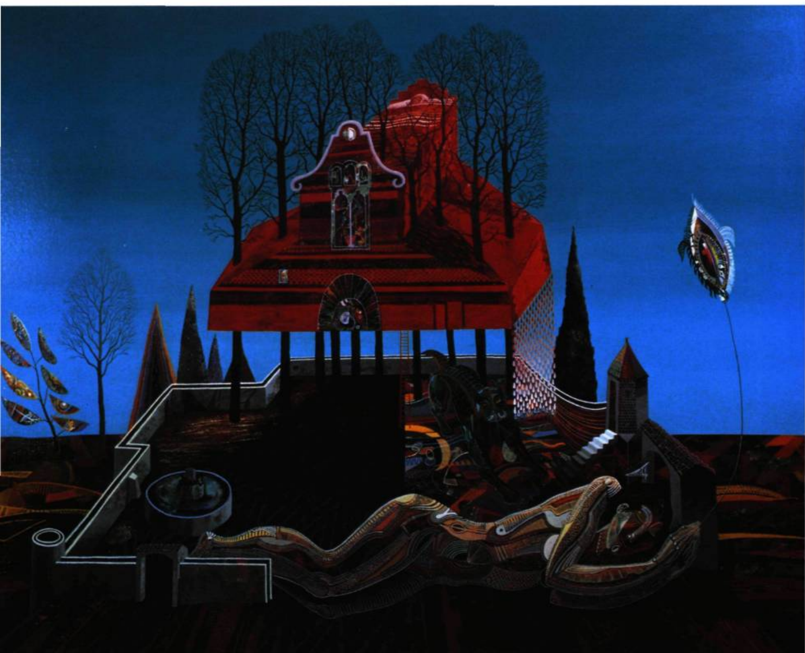
Le lieu du rêve , 1978, détrempe à l'œuf vernie sur masonite, 117 x 147 cm.