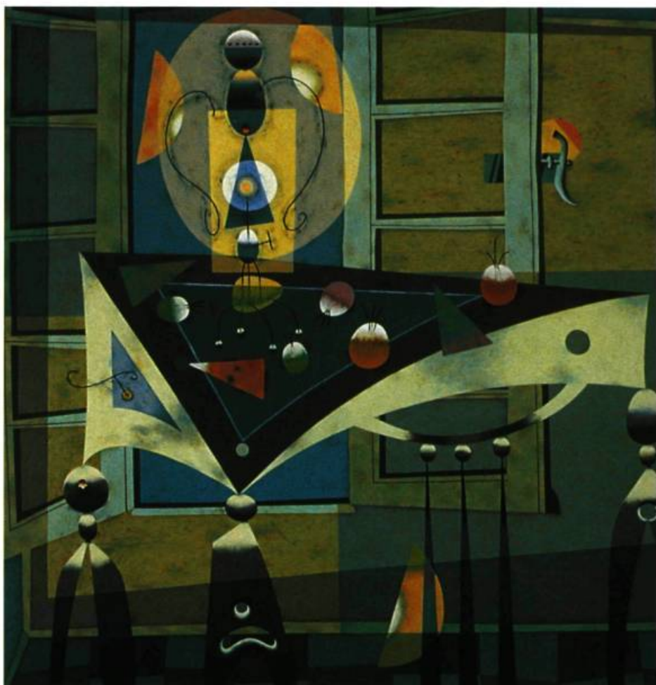
LE PARTAGE D'UNE VISION première exposition de la Collection Lavalin, 174 œuvres présentées (peintures, dessins, sculptures) Musée d'art contemporain de Montréal du 30 avril au 23 octobre 1994

À qui s'est arrêté à réfléchir à l'évolution de la complexité, que ce soit celle des êtres vivants ou celle des collections d'œuvres d'art, il apparaît bientôt qu'ici comme là, de la simple accumulation quantitative d'éléments, il se produit, sans que l'on sache trop comment, des changements qualitatifs importants. Il est bien établi que la complexité des organismes s'accroît en fonction de leurs dimensions, les moins complexes, comme les virus et les bactéries, étant les plus petits et les plus anciens, et les plus complexes, les plus gros et plus récents.