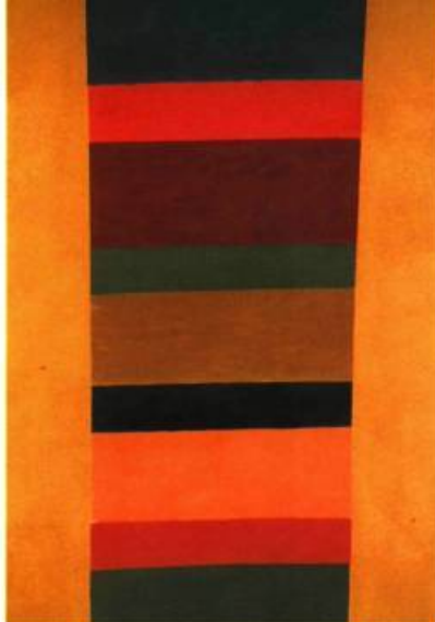
Jack Bush Summer Sand , 1966 Acrylique sur toile, 221 x 145 cm.

certaines de ces œuvres au profit d'autres musées, comme le Musée du Québec qui ne possède pas de nature morte de Leduc. Après tout, chaque musée a son mandat. La deaccession , comme on dit en Amérique, a ses avantages. Tout le monde y trouve son compte: des crédits pour le vendeur, l'acquisition d'une œuvre importante venant compléter sa collection pour l'acheteur.