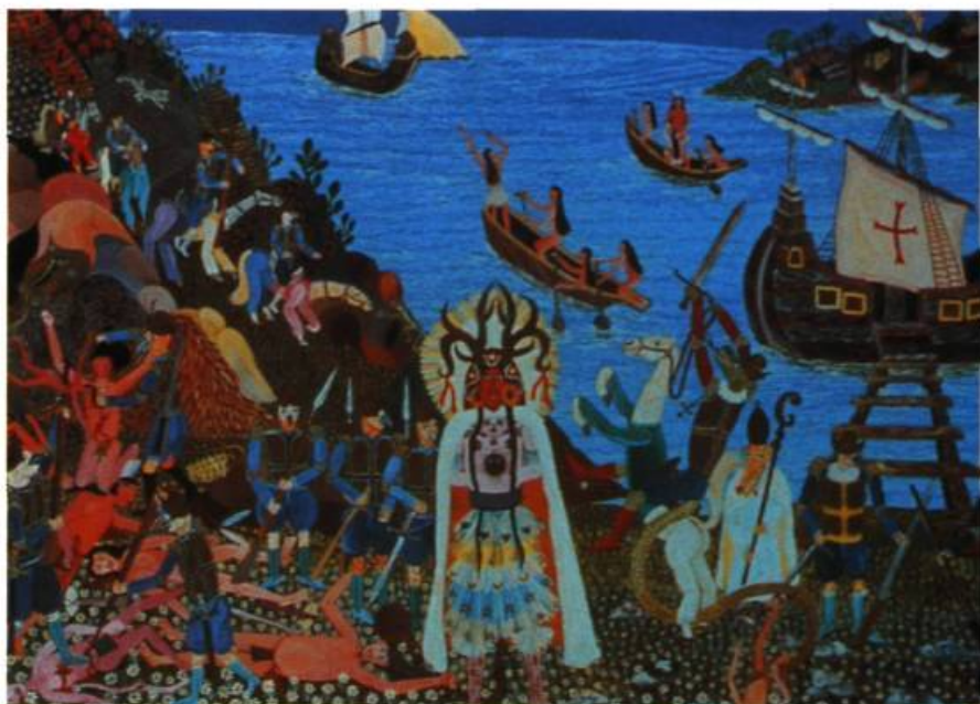
L'arrestation du Cacique Caonabo et sa déportation en Espagne Frantz Zéphirin Acrylique sur toile, 1991 91 x 122 cm Collection Afrique et Créations

■ Les cent tableaux produits par quarante-sept artistes haïtiens contemporains sur le thème de La rencontre des deux Mondes proposent aux visiteurs un survol très particulier de l'histoire haïtienne, de Christophe Colomb jusqu'à la Présidence du père Aristide. Comme l'indique Jean-Marie Drot dans la préface du catalogue : « Des maçons, des chauffeurs de taxi, des menuisiers, gens simples pour la plupart qu'un talent caché puis révélé va métamorphoser en artistes populaires ou modernistes, afin de proposer ensemble, à leurs frères démunis et souvent analphabètes, les images de leur destin commun... »