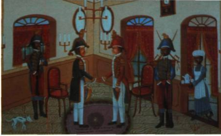
Pétion reçoit Simon Bolivar: le panaméricaniste et le libérateur Alfred Altidor Huile sur toile, 1991 41 x 61 cm Collection Afrique et Créations