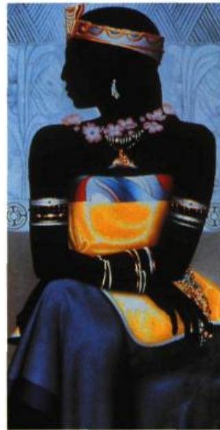
Le portrait d'Anacoana, Reine d'Ayiti Simil Huile sur toile, 1991 102 x 51 cm Coll. particulière

Celle que Bartolomé de Las Casas appelait la Grande dame d'Ayiti, Anacoana, la Fleur d'or, épouse du cacique (roi) Caonabo, périt pendue en 1503.