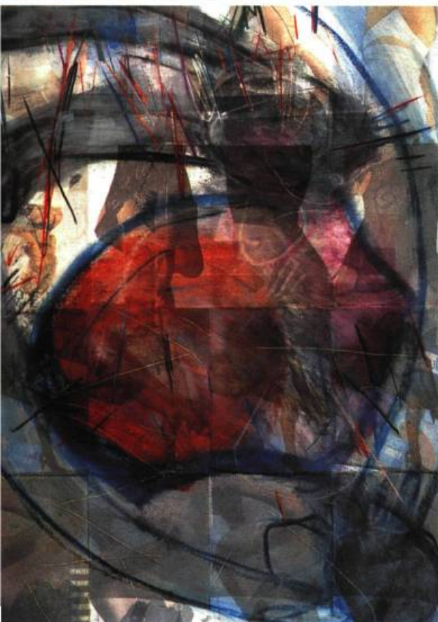
Nativité 2, 1990 Encre d'imprimerie et crayon gras sur papier Arches 95 x 70 cm