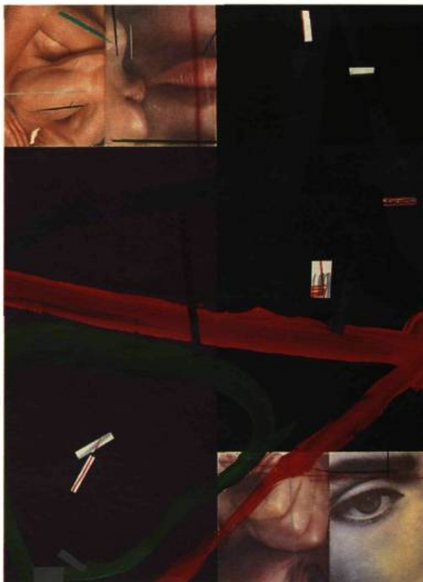
Série la banlieue du vide L'évidence éternelle 6, 1993 Techniques mixtes

alchimistes, elle se nomme la Haute Fusion (la « conjonction des contraires »).