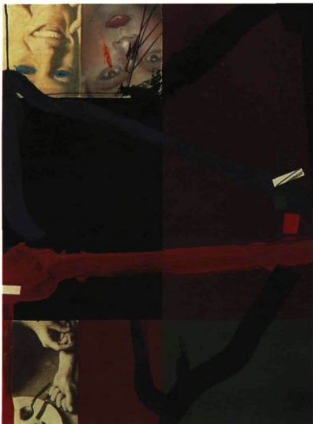
Série la banlieue du vide L'évidence éternelle 5, 1993 Techniques mixtes