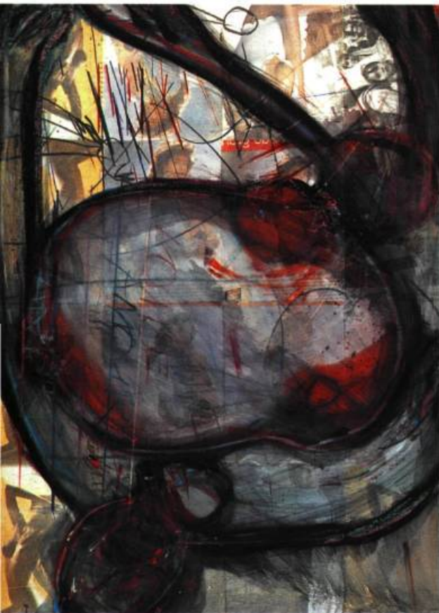
Nativité 1, 1990 Encre d'imprimerie et crayon gras sur papier Arches 95 x 70 cm