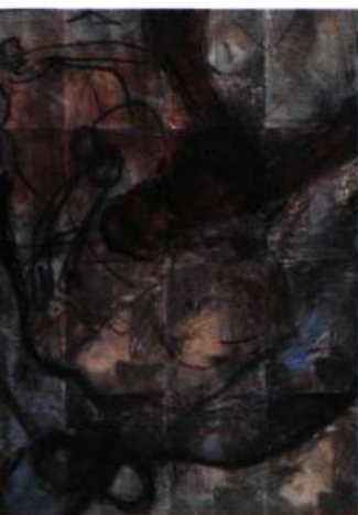
Noctuelles, 1990 Encre d'imprimerie et crayon gras sur papier Arches 95 x 70 cm

et à des aventures visuelles toujours surprenantes et nouvelles. Mais aussi un peu d'attention suffit pour distinguer, entre les ruptures, une continuité. Y a-t-il deux Gérard Zahnd ?