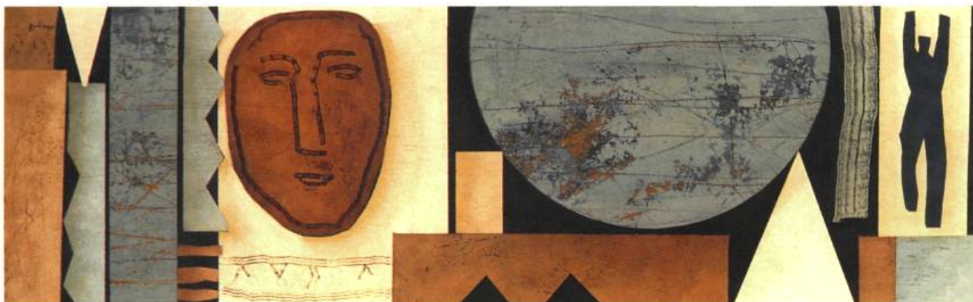
Acrylique sur toile, 1994 40 x 120 cm