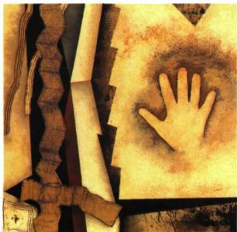
Acrylique sur toile, 1994 50 x 50 cm