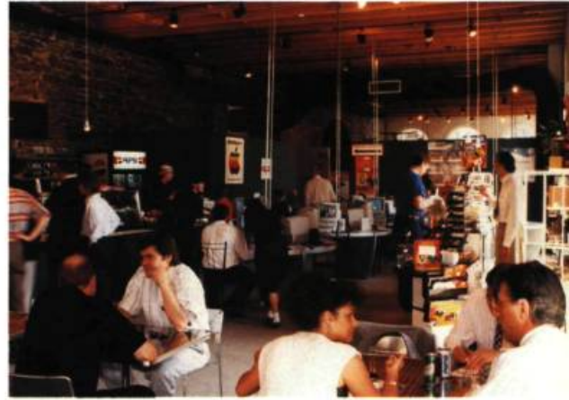
Le café électronique

des rapports art/société. Et à ce titre, l'art sociologique critiquait par diverses stratégies interrogatives la fonction politique de l'art au service de la classe dominante, successivement religieuse, aristocratique puis bourgeoise. L'art sociologique interrogeait donc le statut symbolique de l'œuvre d'art, sa fonction de légitimation de l'élite sociale, son commerce, etc.