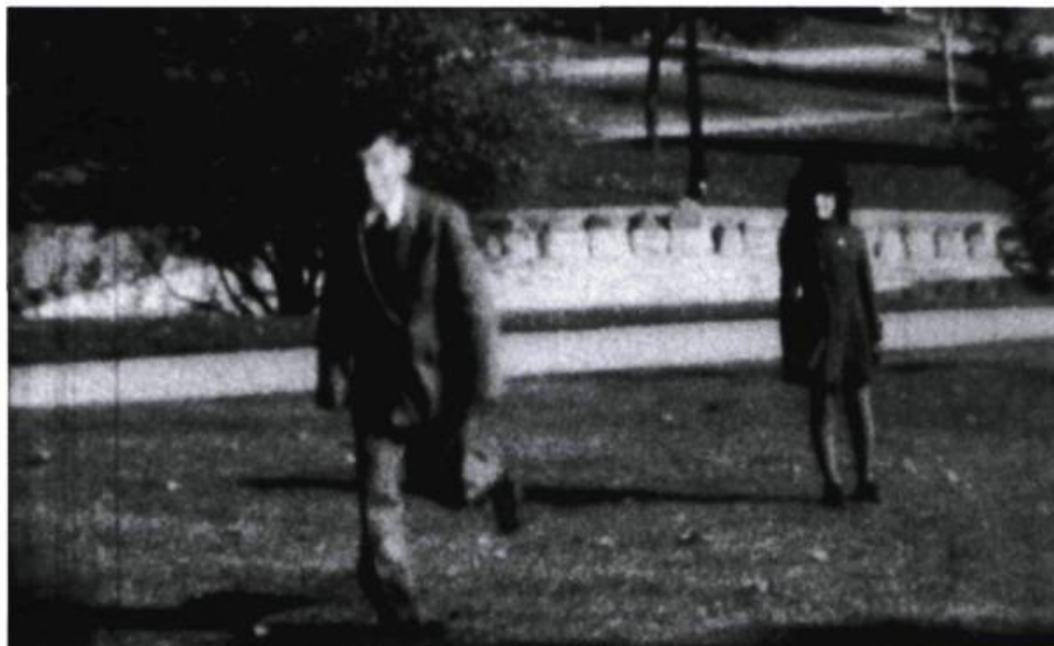
Image du très court film ( 60 secondes) de l'installation Cassandra, an opera in four acts

L'artiste a choisi le dessin « pour sa matérialité », dit-elle. Le papier qui sert de support est épais et texturé. Le fond noir est le lieu d'un subtil chatoisement chromatique produit par l'effet du lustre et de la matité. Le propos est très « matiériste » ; il appelle le toucher. « Le