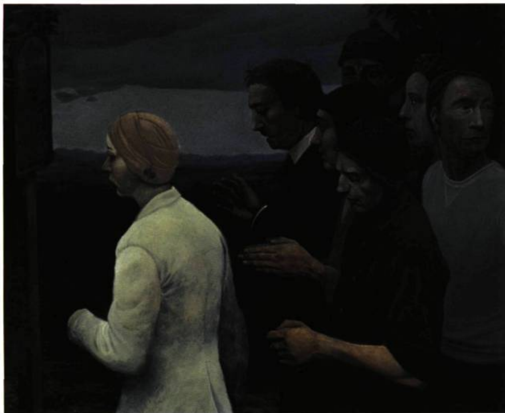
Ex-voto (d'après Legros), 1991 Huile sur toile 110 x 137 cm