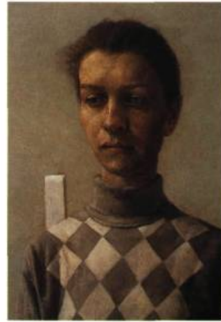
Femme à la jupe blanche (détail)

l'information et je la mets dans un nouveau moule qui fusionne la réalité objective et le contenu subjectif. Je ne conçois pas ces œuvres en tant que portraits d'une correspondance entre une personnalité et ce que je mets sur la toile.