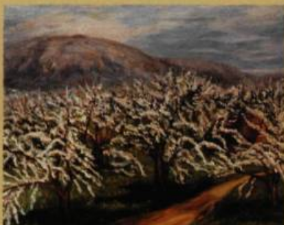
Pommiers en fleurs , 1971 huile sur toile, 60,7 x 76,2 cm collection particulière

L'exposition à caractère rétrospectif réunit une soixantaine d'œuvres représentatives de l'ensemble de la carrière de Gabrielle Messier depuis ses débuts (au tournant des années 1940) jusqu'à aujourd'hui (Gabrielle Messier peint toujours), marquant ainsi 50 ans d'activité picturale.