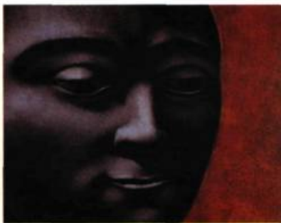
Lorène Bourgeois Le Songeur , 1996 Monotype 52 x 86 cm

L'Art et le Papier II Galerie Jean-Claude Bergeron Du 13 au 29 juin 1996