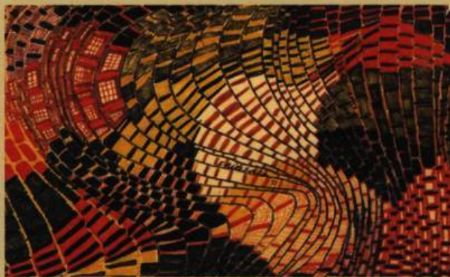
Crayon de couleurs, 1973 22 x 35,5 cm

L'initiative est touchante. Elle a au moins le grand mérite de proposer une vue complète de l'évolution habituelle de l'enfant dans nos sociétés: sa perception des objets quotidiens, sa progressive maîtrise de l'espace. Dans le cas d'Éric, il