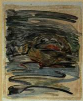
Léopold Plotek Burning of musical instruments on the River Moscow, 1996 Acrylique sur papier 45 x 65 cm

Hormis la Biosphère, le principal partenaire du projet est La Mutuelle du Canada qui soutient financièrement l'aspect matériel du projet. Pour informations: 34, Vignory, Lorraine, J6Z 1V4, tél: (514) 965-4306.