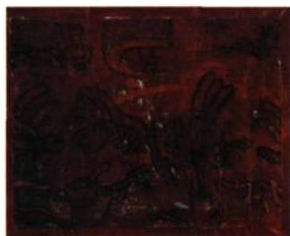
Mur de cuivre 1994 Huile et acrylique sur toile 120 x 150 cm

La recherche au niveau du développement spatial constitue l'épine dorsale de mon travail. De fait, le tandem couleur-dessin en est le grand responsable, celui qui vient articuler les divers plans.