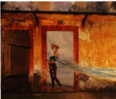
Jacques Léveillé, La vague bleue