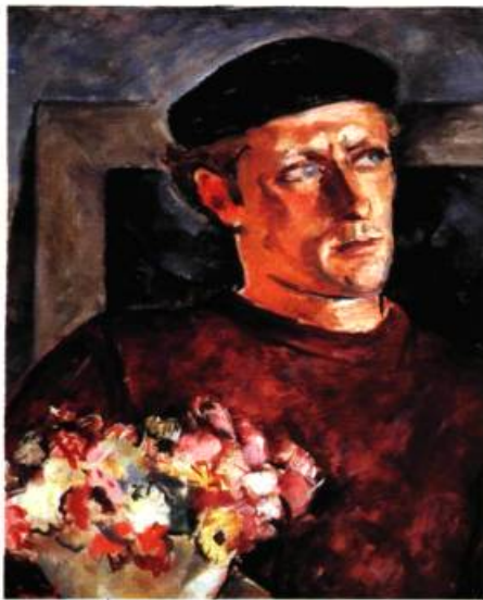
Jori Smith Portrait de Jean Palardy, 1938 Huile sur toile 66 x 45,5 cm