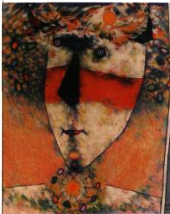
Jean Dallaire, Tête cocasse