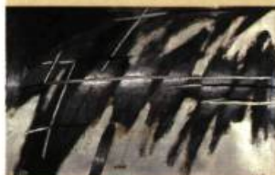
Silence Techniques mixtes sur papier 76 x 112 cm