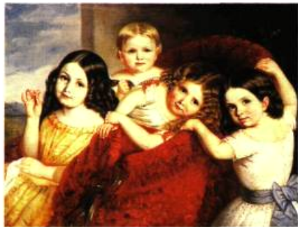
Théophile Hamel, Noémie, Eugénie, Antoinette et Séphora Hamel, nièces de l'artiste (détail) , 1854

DES ŒUVRES MAJEURES SÉLECTIONNÉES PARMILA TRÈS GRANDE COLLECTION DU MUSÉE DU QUÉBEC