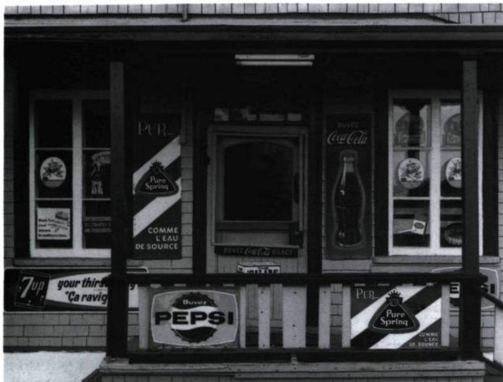
Magasin général, Saint-Joseph de la Rive, 1970