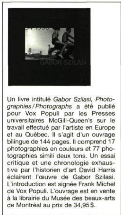
Un livre intitulé Gabor Szilasi, Photographies/Photographs a été publié pour Vox Populi par les Presses universitaires McGill-Queen's sur le travail effectué par l'artiste en Europe et au Québec. Il s'agit d'un ouvrage bilingue de 144 pages. Il comprend 17 photographies en couleurs et 77 photographies simili deux tons. Un essai critique et une chronologie exhaustive par l'historien d'art David Harris éclairent l'œuvre de Gabor Szilasi. L'introduction est signée Frank Michel de Vox Populi. L'ouvrage est en vente à la librairie du Musée des beaux-arts de Montréal au prix de 34,95$.

modelé. Le talent de Szilasi, tient à son pouvoir de saisir le rapport des valeurs, c'est-à-dire des nuances de gris qui constituent l'image, et de les capter selon et pour les réactions de la pellicule photographique.