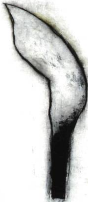
Sacerdotal , 1997 144 x 122 cm Techniques mixtes