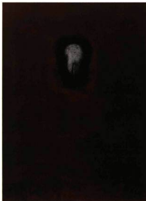
On ne veut pas toujours voir , 1997 163 x 121 cm Techniques mixtes

MÊME DE LA PEINTURE DE FRANÇOIS-XAVIER MARANGE.