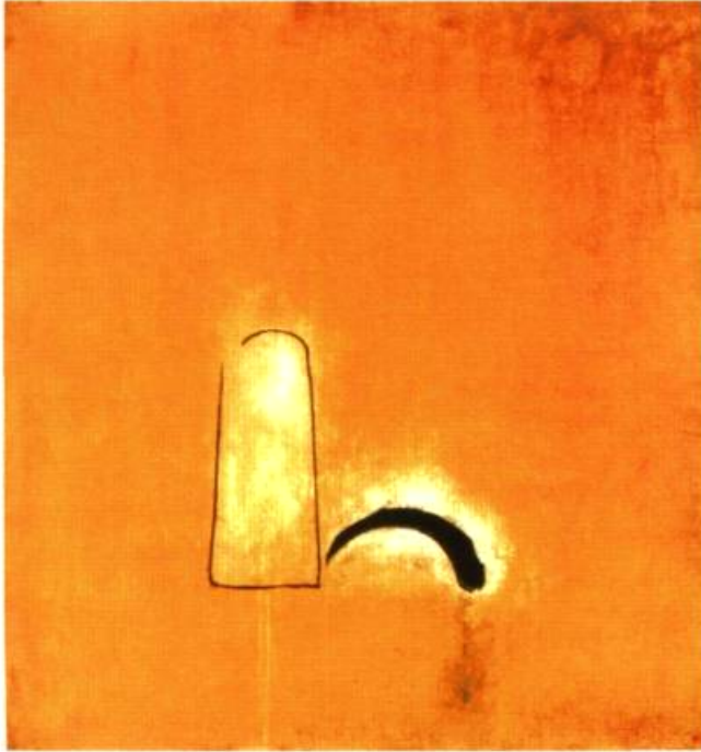
Les instants d'après, 1996 113 x 124 cm Techniques mixtes