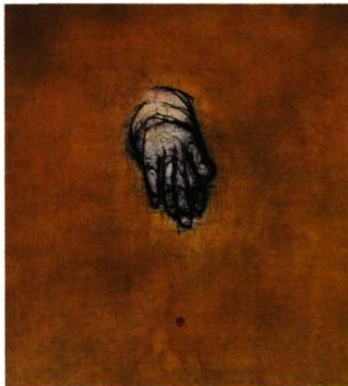
Autoportrait, 1998 64 x 57 cm Acrylique sur toile

dépasse largement la traduction qu'il peut en faire « Intention de pureté », dit-il. Mais la pureté dont il s'agit n'a rien à voir avec un quelconque idéal platonicien. Elle serait plutôt la tentative de faire signe, le plus honnêtement possible, à une vérité inaccessible à l'homme parce qu'elle ne constitue ni son passé ni son futur, et qu'elle perd à la fois pour lui son nom et son sens parce que tout en étant présente dans son aujourd'hui, elle est aussi, et surtout, la totalité de son « avant » et de son « après ». Que ses œuvres conviennent à cette réflexion essentielle avec la plus grande des simplicités est tout à l'honneur de cet artiste. □