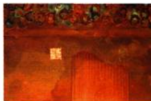
Liu Lan Ding Eternal Diary Technique mixte sur toile, 1998 35, 5 cm x 30 cm

À l'occasion de l'exposition organisée par Josette Oberson Kumming-New York-Montréal : carnet de voyage regroupant des œuvres de onze artistes de Chine ou d'origine chinoise travaillant aux États-Unis ou au Québec, la galerie Observatoire 4 a publié un catalogue. Ce document comporte des notes biographiques sur les artistes, ainsi qu'une reproduction d'une de leurs œuvres mais aussi deux essais originaux et percutants qui permettent de mieux saisir les enjeux auxquels font face les artistes confrontés à deux cultures, la leur et celle du pays où ils résident. Sous le titre Les signes de sinité de l'art chinois contemporain , Marie-Claire Huot, professeur agrégée au Centre d'études de l'Asie de l'Est, examine notamment les vicissitudes d'allier art chinois et art contemporain qui débouchent sur le constat de complexité du statut de l'art chinois. De son côté, Lian Duan, candidat au doctorat en Études de l'Asie de l'Est à l'Université McGill, propose sous le titre Three Cities : A Cultural Confrontation , une discussion sur le travail des onze artistes de l'exposition d'où émerge la question qui transcende sans ironie les notions de culture et d'enjeux ethniques : qu'est-ce qu'être un artiste aujourd'hui ?