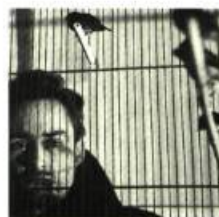
Maurice Perron Pierre Gauvreau derrière une cage à oiseaux Vers 1950

Une sélection d'une cinquantaine de photographies de Maurice Perron, l'un des seize signataires du manifeste Refus Global, vient clore l'année du cinquantième anniversaire du célèbre manifeste. Organisée par M. John R. Porter, directeur du Musée du Québec, l'exposition Mémoire objective, mémoire collective: photographies de Maurice Perron réunit principalement des clichés qui témoignent des événements et des personnages qui ont animé l'aventure automatiste. Elle comprend également des clichés réalisés en 1998. Un catalogue regroupe toutes les photographies de l'exposition. Il comprend en particulier un entretien du photographe avec Nathalie de Blois, conservatrice de l'exposition.