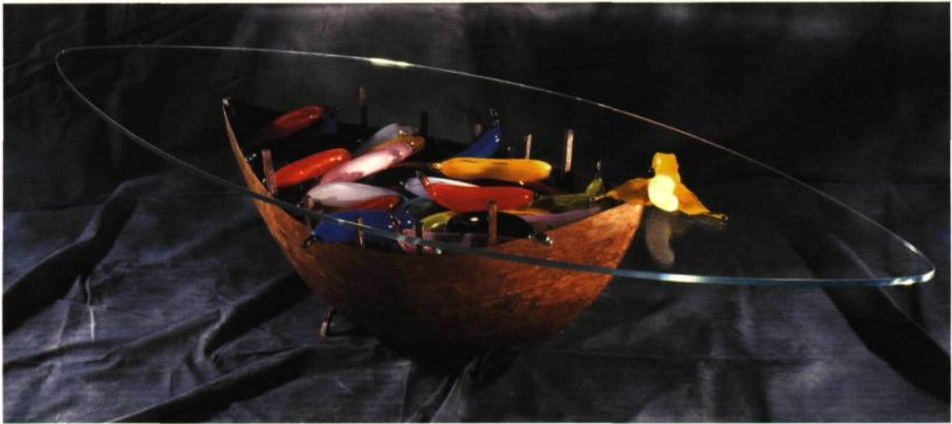
Ronald Labelle, un des 2 fondateurs de Espace Verre Banana Boat Song , 1998 verre soufflé, acier rouillé, patine 40 cm x 1,8 m