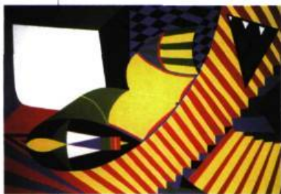
Compassion, 1999 Acrylique sur toile 60,5 x 91 cm

MIMA MAZHARI Galerie des arts contemporains 2165, rue Crescent, Montréal Du 20 mars au 20 avril 1999