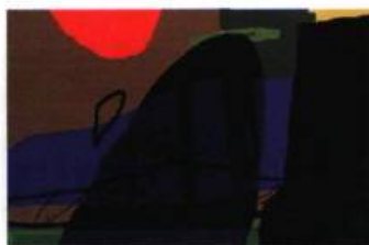
Au bout du continent Encre sur papier (monotype à l'ordinateur)

Cette rétrospective réunissant une sélection d'œuvres réalisées au cours des vingt-cinq dernières années donnera au visiteur une bonne idée de la production de celui qui fut, jusqu'en 1992, vice-président aux communications chez Pratt & Whitney pour ensuite être président-fondateur de la Fondation pour l'Art thérapeutique et l'Art brut du Québec. Les peintures réalisées au cours des années 70 et 80 témoignent de la « manière » figurative que l'artiste délaissera à la fin des années 80 pour se diriger vers une expression abstraite où la couleur seule détermine formes et surfaces. Un cheminement à contre-courant de la peinture des quinze dernières années axée sur le retour de la figuration.