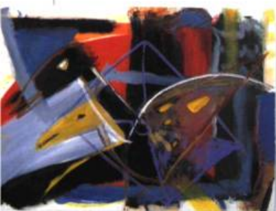
Kittie Bruneau Cormoran dans un filet , 1998 Acrylique sur papier 75 x 106 cm

Bibliothèque nationale du Québec 1700, rue Saint-Denis, Montréal (514) 873-1100 Du 18 mai au 4 juin 1999