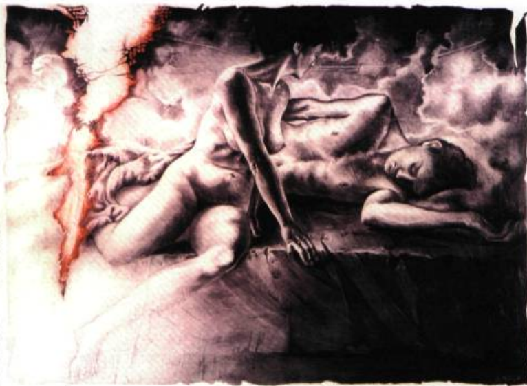
Lilith quittant le lit d'Adam, 1996 graphite, acrylique sur papier 56 x 76 cm

est la principale source d'inspiration de la série de tableaux qu'expose Lilian Broca à la Galerie de l'Université Concordia. L'artiste présente dans la veine symboliste des images métaphoriques de l'éternelle attirance et concurrence homme-femme, et la figure mythique d'une humanité incarnée par une femme.