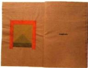
Portefolio Visage des lieux 22 x 75 cm

Le carrefour, le promontoire, la jetée, l'enceinte... ces mots désignent des lieux. Ils évoquent, simplement à les lire ou à les prononcer, des souvenirs, des événements, des mo-